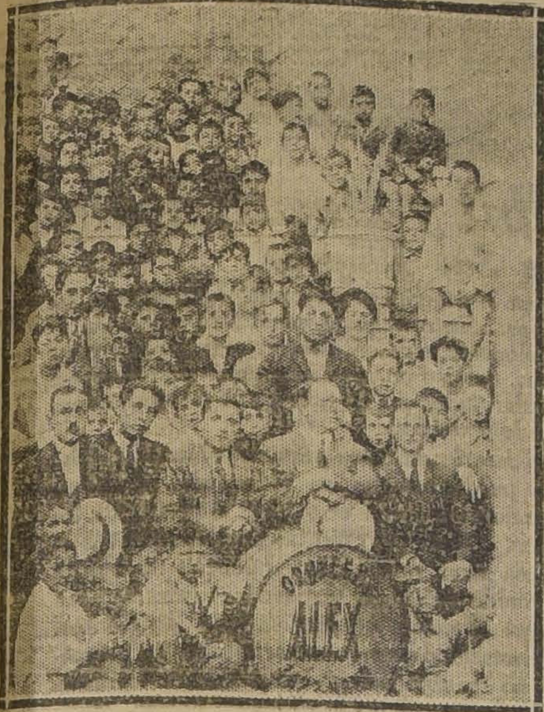
Durante la visita de caridad practicada por el Bando de Piedad al Asilo Marítimo de Cartagena

HERMOSAS FIESTAS DE CARIDAD EN CARTAGENA Y VISA DEL MAR