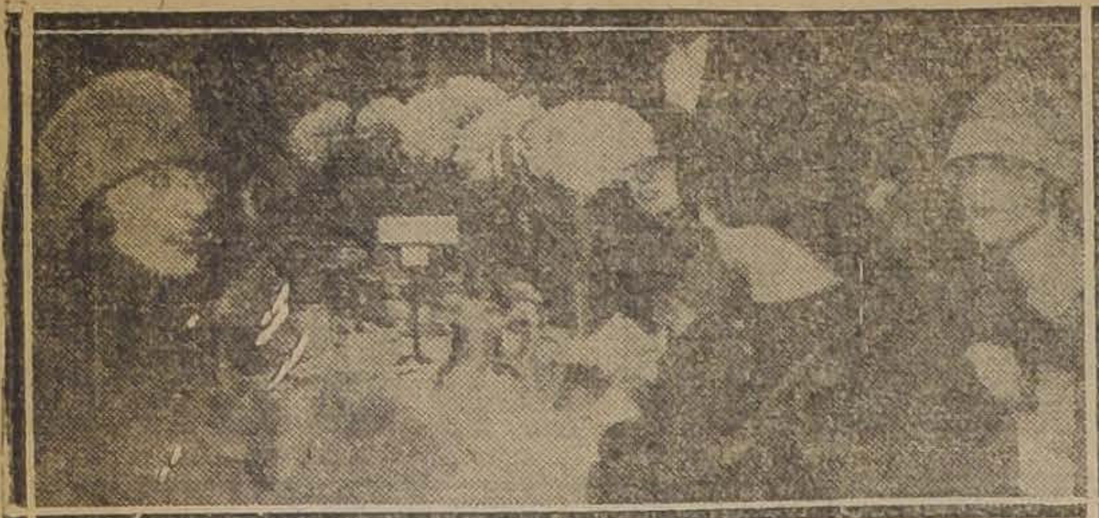
Asistentes al té que ayer tarde les ofreció un grupo de amigas a las señoritas Elvira y Beña Valdés Freire, con motivo de su regreso de Europa