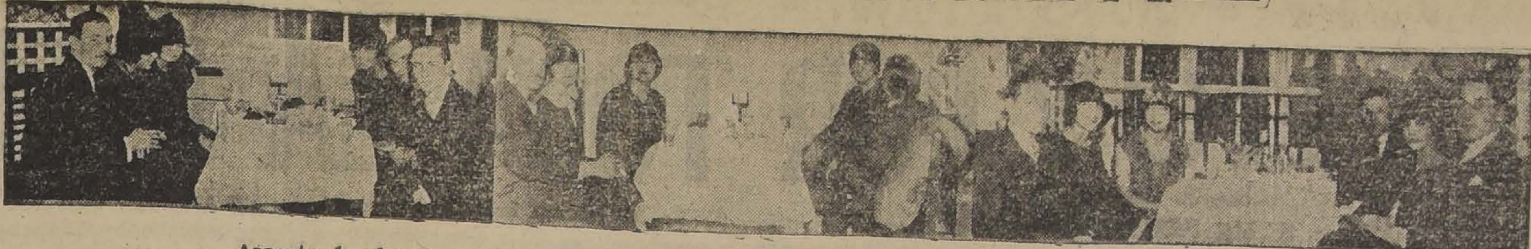
Aspecto de algunas mesas durante la reunión de moda de ayer tarde en la Terraza Armenonville LA RECEPCION DE AYER.