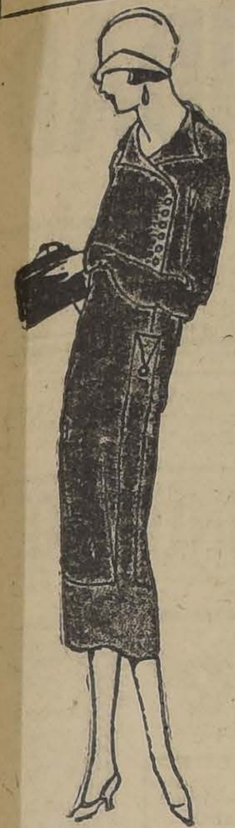
Bañera de Popelina de lana azul