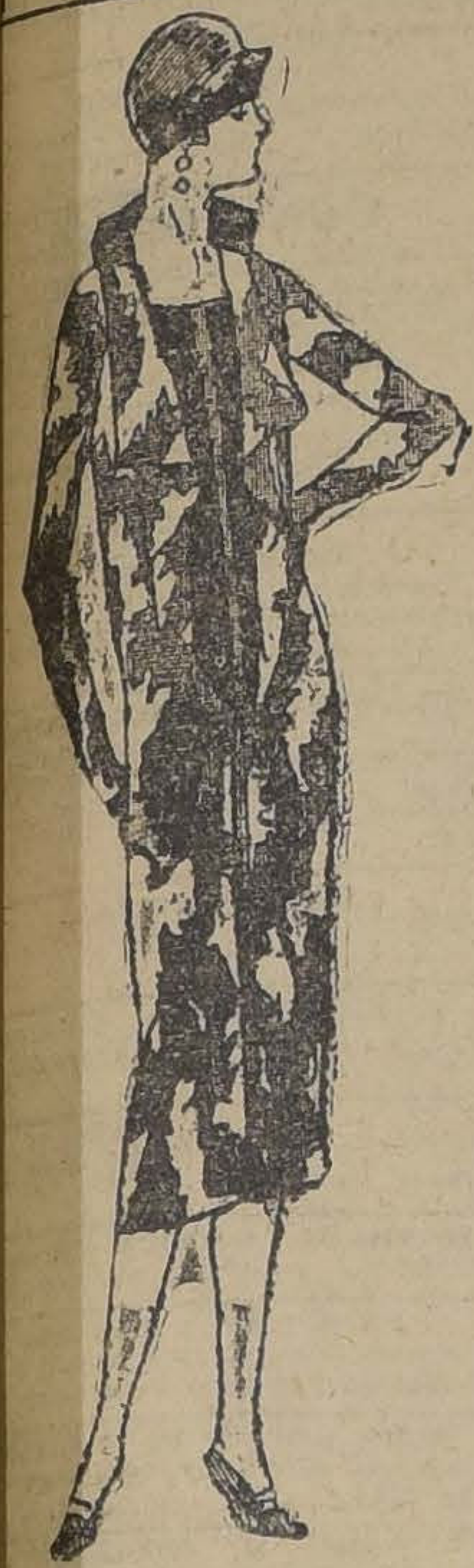
Chiffon negro con grandes rosas rojas estampadas.