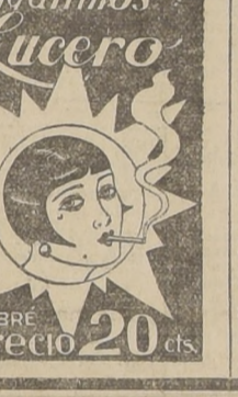
Cigarillos Lucero. Precio 20 cts.

PARTIDO RADICAL. ASAMBLEA RADICAL DE SUEA.—Hoy, a las 7 P. M., en la secretaría comunal, Irarrásva 3401, celebrará sesión esta colectividad política.