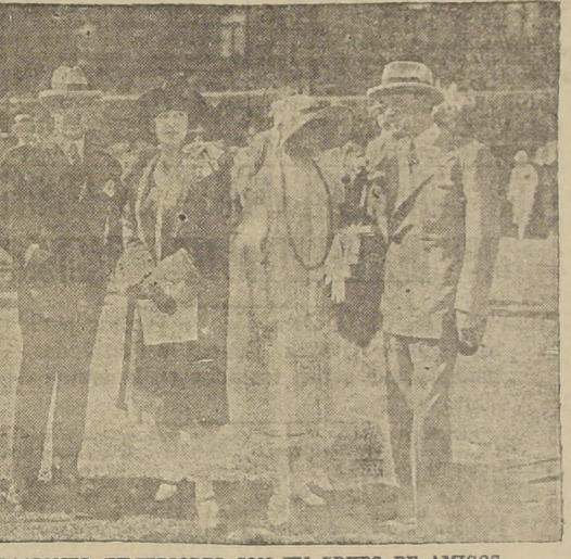
EL MINISTRO DE RELACIONES EXTERIORES CON UN GRUPO DE AMIGOS