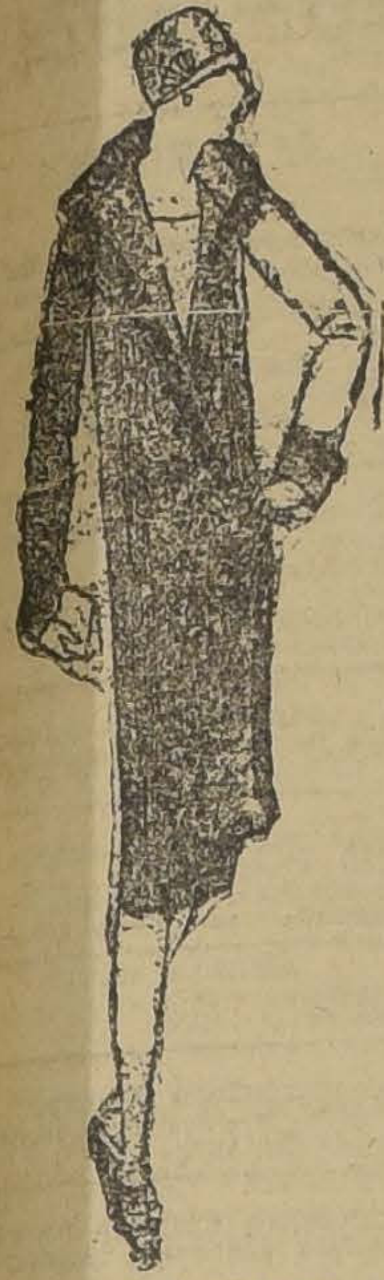
ABRIGUITO DE NASHA AMARILLO CON TIRAS AZULES