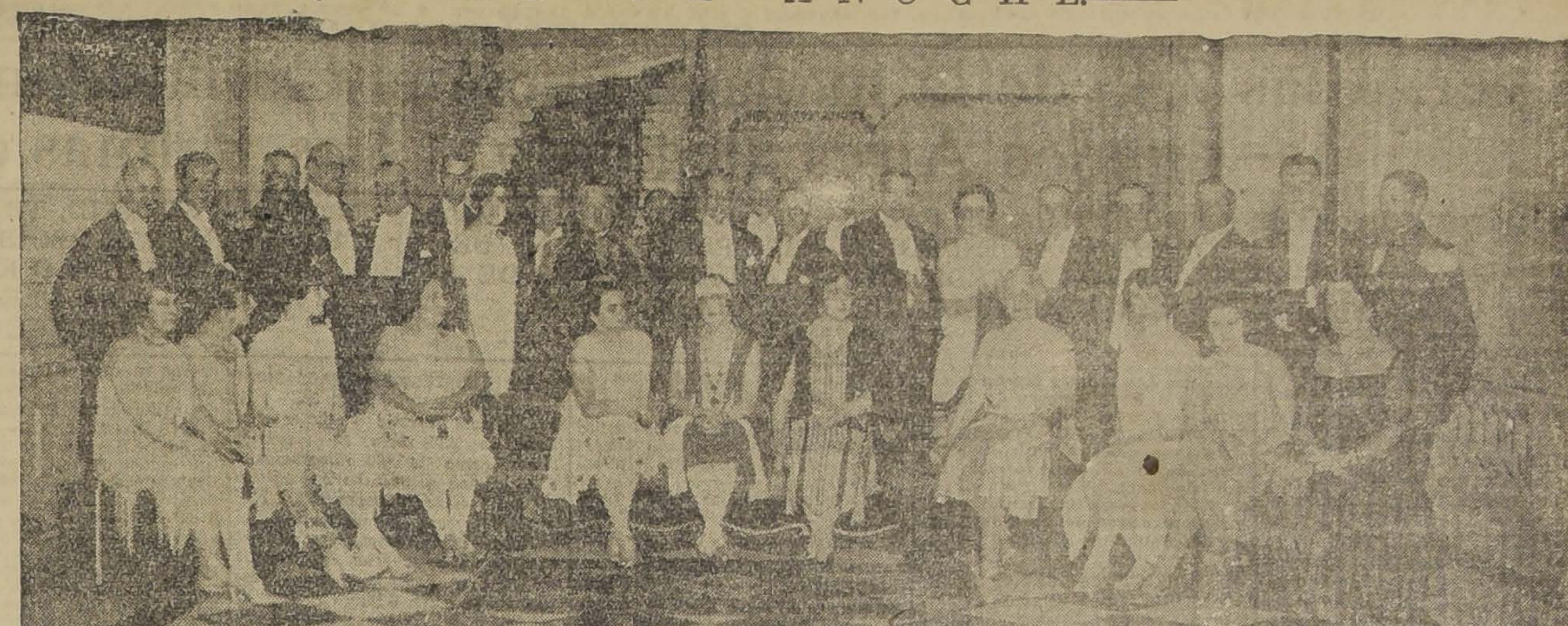
ASISTENTES AL BANQUETE