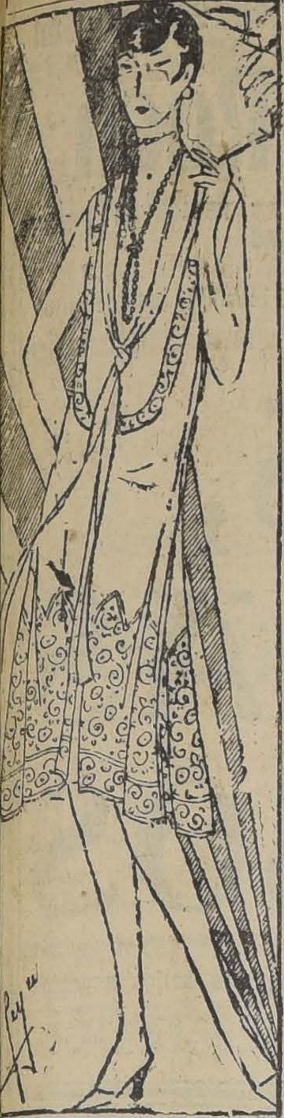
VESTIDO DE MUSELINA DE SEDA DE GRANDES FLORES ESAMPADAS Y APLICADAS, VELADAS CON UN ENCAJE NEGRO