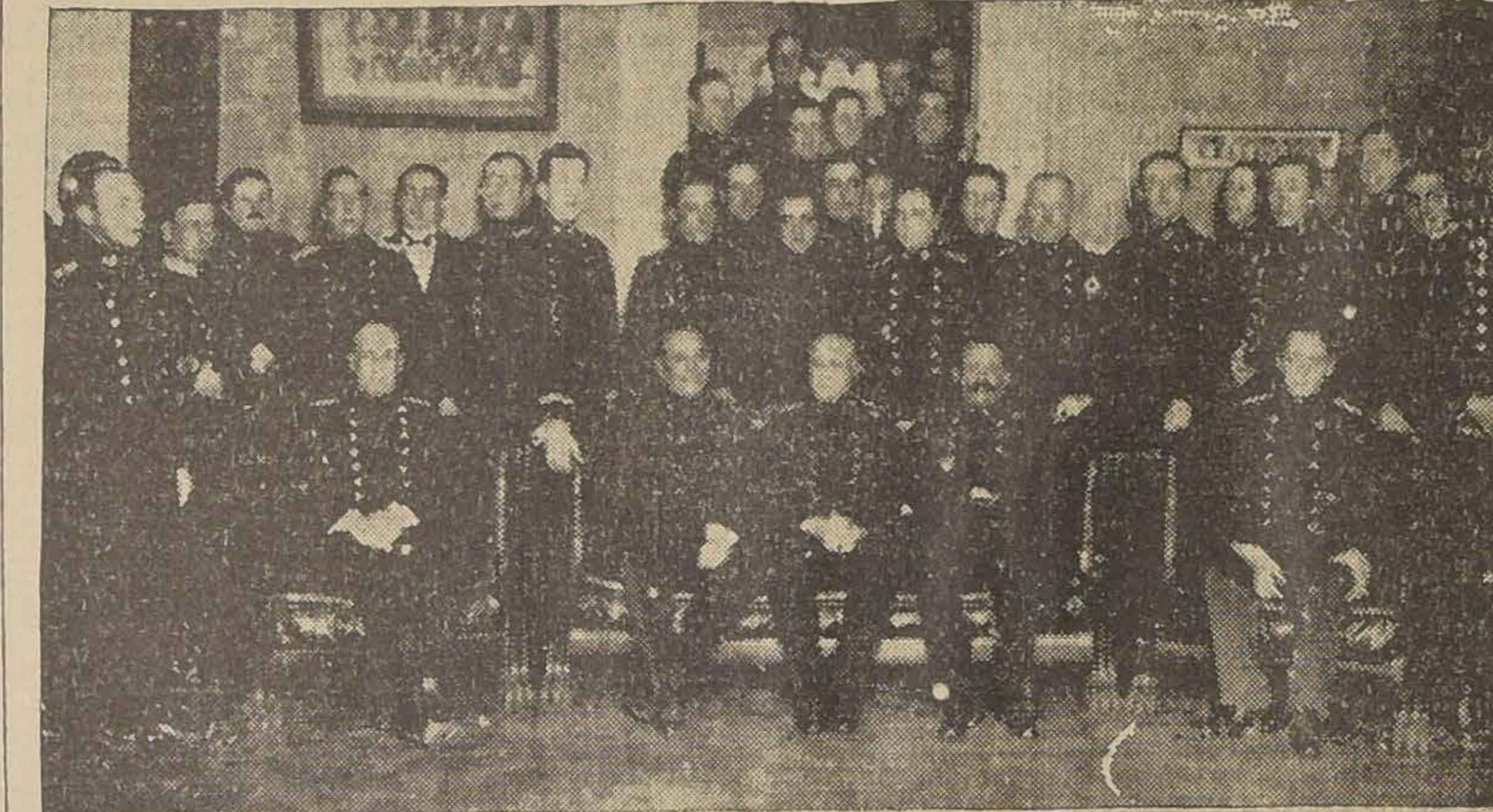
EL FESTEJADO, ENTRE EL INSPECTOR GENERAL DEL EJERCITO, Y EL GENERAL SEÑOR FRANCISCO J. DIAZ, Y RODEADO DE LA OFICIALIDAD DEL GRUPO DE ARTILLERIA A CABALLO.