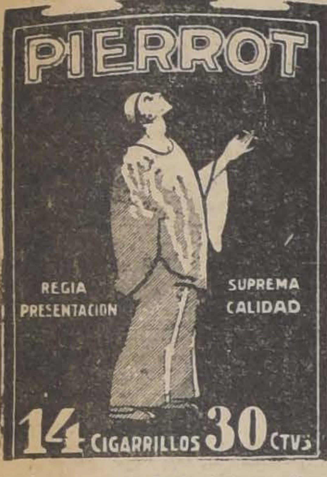
PIERROT REGIA PRESENTACION SUPREMA CALIDAD 14 CIGARRILLOS 30 CTVS