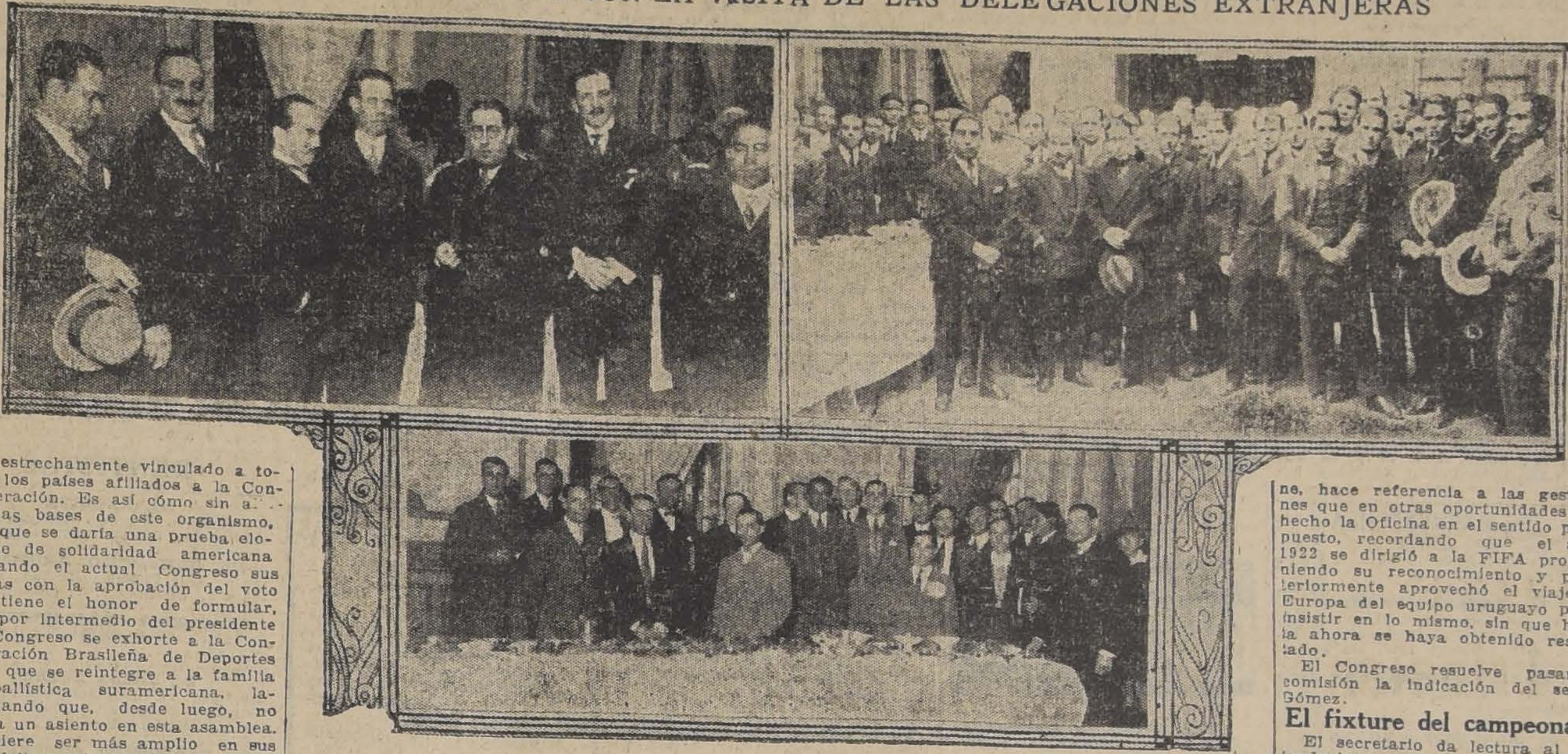
Diversos aspectos de la recepción de ayer en “La Nación”, en honor de las delegaciones extranjeras

NUESTRA CASA ES HONRADA AYER CON LA VISITA DE LAS DELEGACIONES EXTRANJERAS