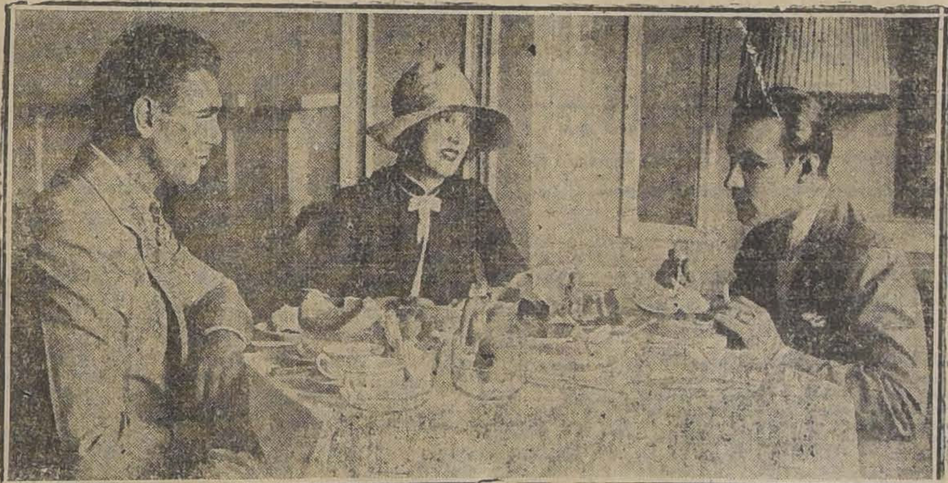
Ultima fotografia de Rodolfo Valentino, tomada pocos dias antes de caer enfermo. Le acompañan Estelle Taylor y Jack Dempsey

El Avenida Matta anuncia para hoy en sus dos funciones: "Arpillera y Armino" y "Nunca me separaré de mi madre". "Arpillera y Armino" es una lindísima comedia Paramount que se desarrolla en Nueva York, en mitad del siglo pasado y cuyo argumento cuenta la historia de una muchacha romántica y encantadora que se adueña del corazón de un aristócrata después de sufrir un verdadero calvario de desilusiones. La in-