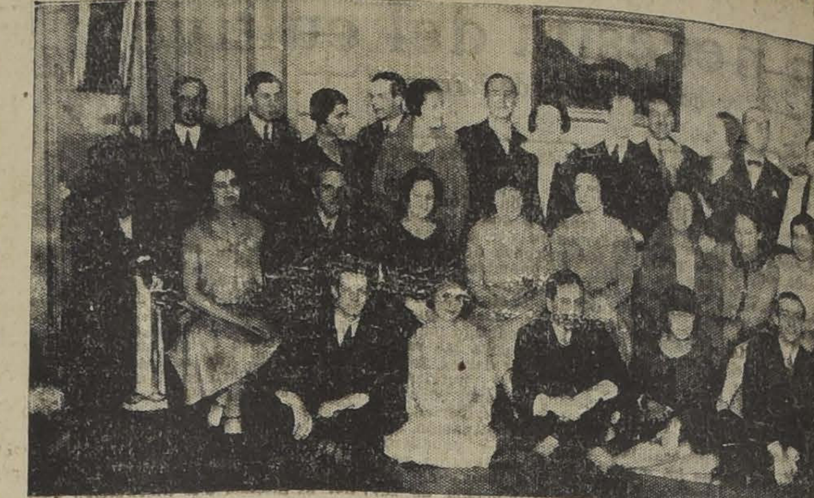
Grupo de niñas y jóvenes de nuestra sociedad que tomarán parte en el concierto que se dará en el teatro Splendid hoy Miércoles 1.º de Diciembre, a beneficio de los niños asilados del Buen Pastor.