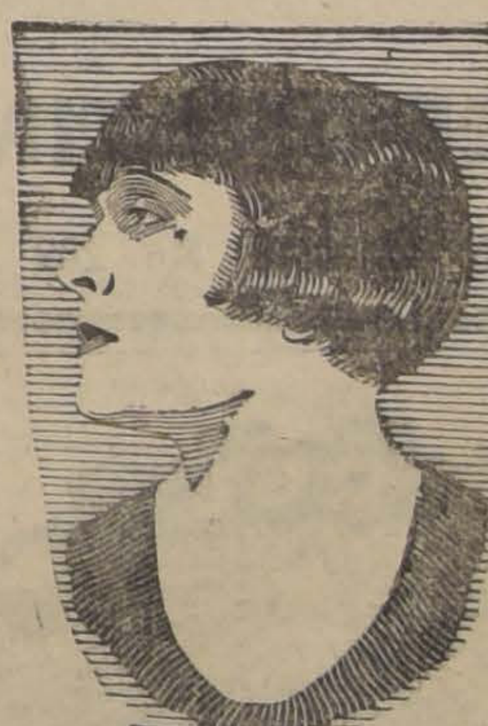
POLA NEGRI IN THE PARAMOUNT PICTURE "FLOWER OF NIGHT"