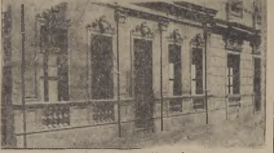
La casa donde ocurrió el crimen