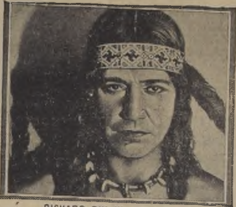
RICHARD DIX IN ZANE GREY'S "THE VANISHING AMERICAN" A PARAMOUNT PICTURE

Pocas veces un actor de cine... especialmente un actor que se ha dedicado a roles atléticos y pugilísticos... puede realizar un trabajo tan perfecto, tan acabado y artístico como el que lleva a la pantalla Richard Dix en la super producción Paramount "El ocaso de una raza" que se estrenará en el Victoria el martes 11 del presente.