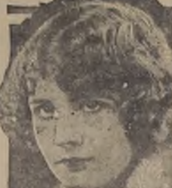
"El santuario del amor perdido" es una emocionante novela de pasión...