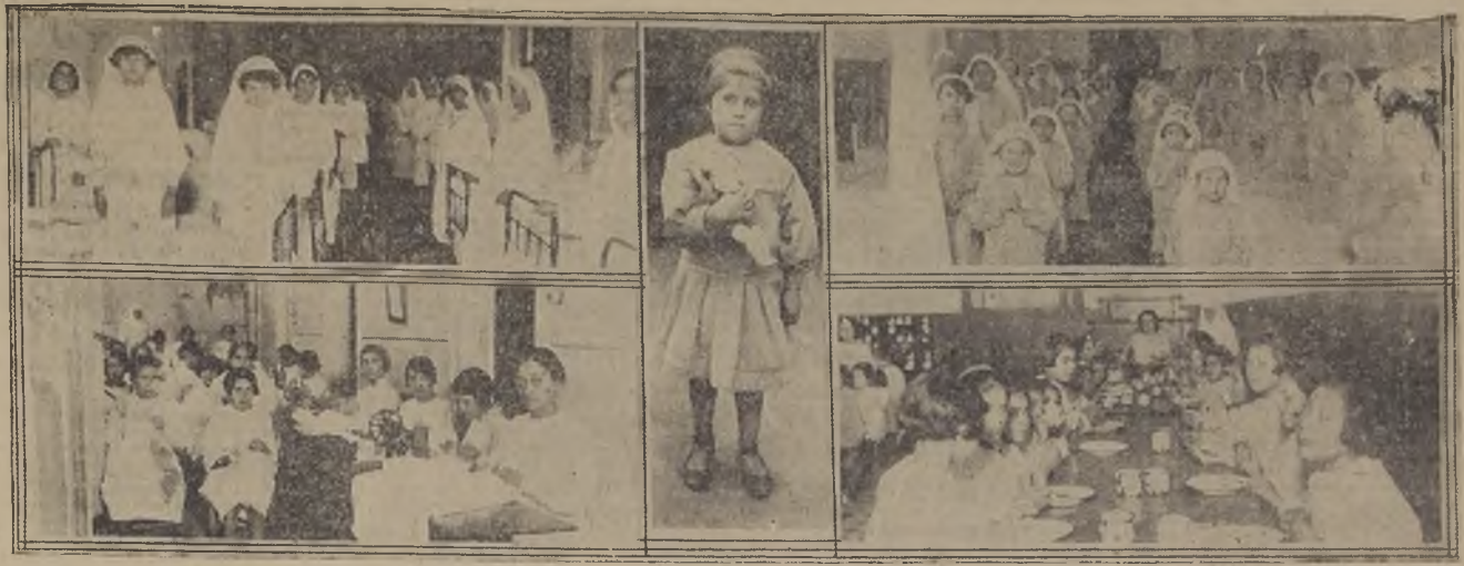
1. El dormitorio de las que trabajan en el taller — 2. En plena labor en la galería que da al jardín — 3. La más pequeña de las asiladas — 4 y 5. El dormitorio y comedor de las chicas

Cumple mañana 50 años de existencia una simpática Orden Religiosa, la de las Franciscanas Misioneras de María que, desde el año 1904, ha desarrollado en Chile su misión de abnegación en beneficio de las clases desvalidas, a la que ha sabido dar un alcance de verdadera y bien inspirada labor social entre nuestra clase popular.