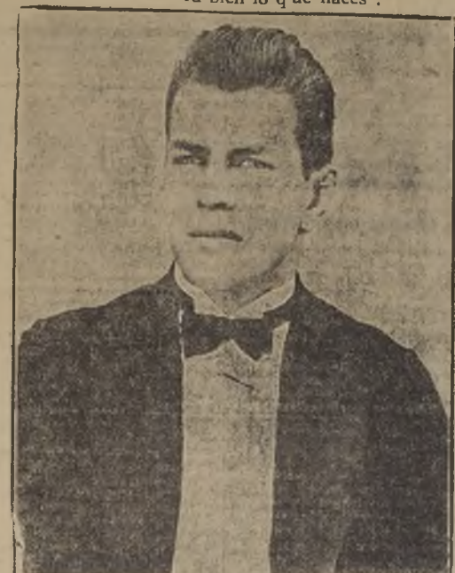
El campeón sabe manejar admirablemente sus puños y también lucir con elegancia un flamante "smoking".