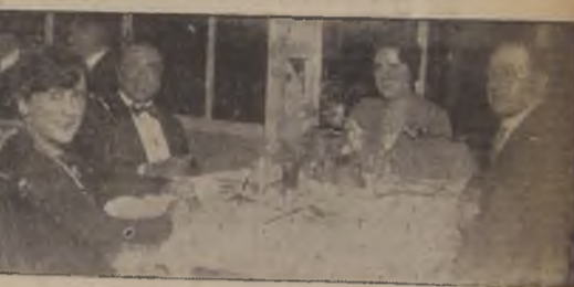
En el Roof Garden Al Pavo Real

EN EL GRAN HOTEL DE VIÑA DEL MAR. — Circula la siguiente invitación: "Tenemos el agrado de invitar a Ud. y relaciones para el Domingo 23 del presente, a la inauguración del Dancing al aire libre, recientemente construido en el Parque de este Hotel, fecha que coincide con la iniciación de los señores Damsant de Gala que semanalmente ofrecerá la Administración a las familias veraneantes de Viña del Mar. Las fiestas de esta temporada se distinguirán por la variedad de atracciones muy modernas, siendo éste un poderoso medio para dar mayor brillo a estas reuniones de la élite en Viña. Para mayor eficacia y esmero en el servicio y atención a nuestros distinguidos clientes, rogamos de retener las mesas con anticipación. Saluda atentamente a Ud. LA ADMINISTRACION.