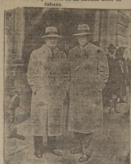
Gene Tunney — a la derecha — se nos muestra en pose elegante, en el momento de dirigirse a una reunión social.