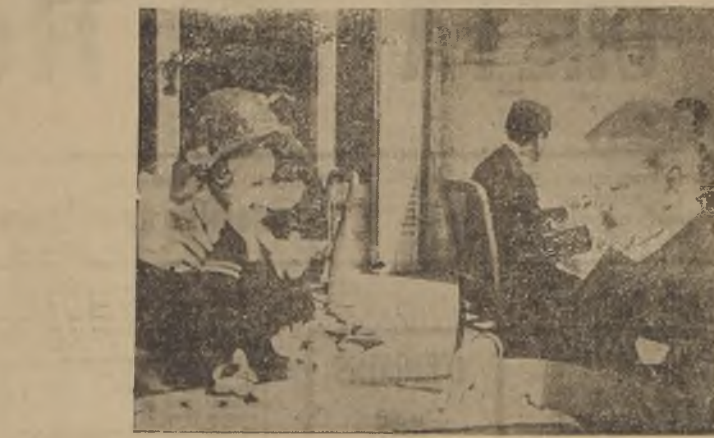
La orquesta Grazioli ha compuesto un interesante programa musical para las funciones de hoy