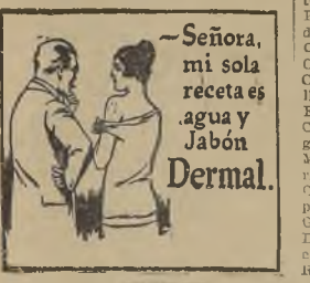
Señora, mi sola receta es agua y Jabón Dermal.