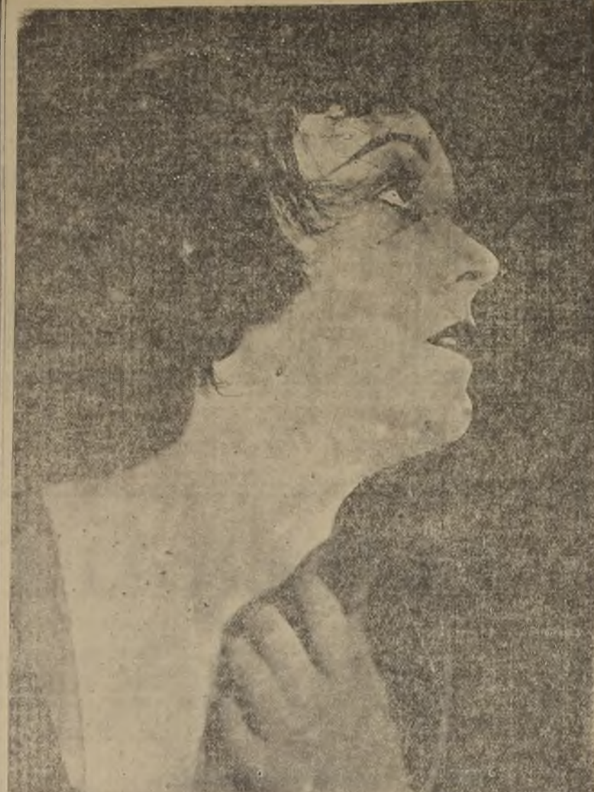
Un. de los mayores atractivos que posee la super-producción Paramount "La bailarina española", lo constituye la presencia en ella de Pola Negri y Antonio Moreno, cuyos temperamentos influyen de un modo extraordinario en la actividad y pasión de la obra, de suyo romántica y pasional. Marilina, la hermosa bailarina que, al transferir por los caminos de España, avanzando y leyendo el porvenir de las gentes, se ve envuelta en aventuras que vienen a cumplir su vida y a hacer interesante su condición gitana, está maravillosamente encarnada en la turbulenta Pola Negri. Antonio Moreno, para quien estos ambientes españoles son familiares, adorna en forma sorprendente la figura moral y física de un noble español, de don César de Ba-