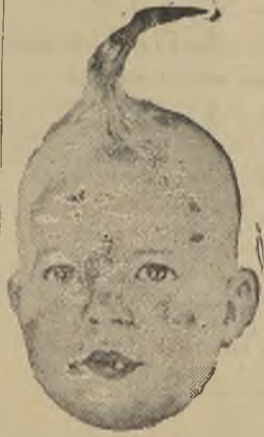
La guagua prodigio TRABAJARA

EN EL O'HIGGINS VARIACIONES POR DUARTE —Y— Programa Cón