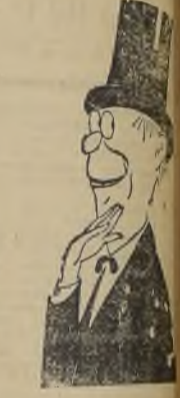
El rey de la risa El más cómico de los clowns

Setiembre, Carrera, Esmeralda, y O'Higgins. (Fuera de programa).