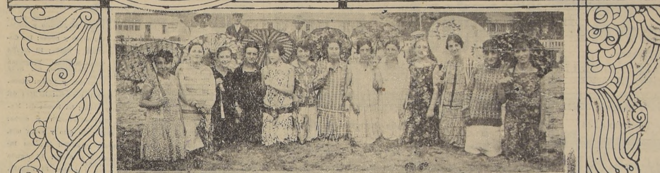
Pocos años, como en el presente, ha alcanzado el brillo y enorme afluencia de veraneantes en el vecino balneario de Cartagena — Damos algunos grupos tomados en la playa.

—En el vapor Aconcagua llegó el ex-Presidente de la República del Ecuador, Excmo. señor Florencio Córdova, acompañado de su familia.