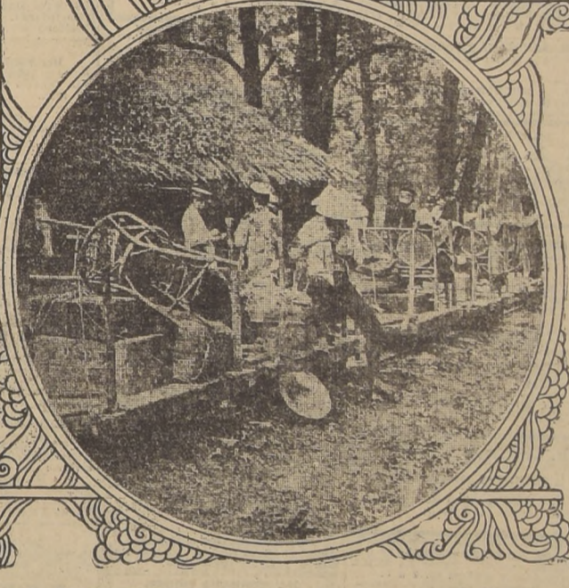
4. El expreso de Formosa: un tren de trocha angosta.

atráidos por la llamarada de oro de su leyenda y los intrépidos portugueses, pasados ante la belleza de sus costas exuberantes, la bautizaron con el melodioso nombre de Formosa, que quiere decir hermosa.