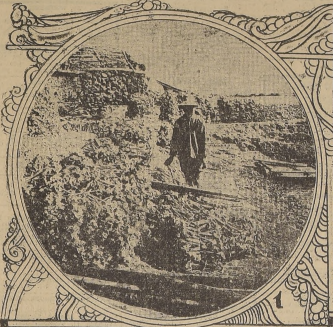
1. Los criaderos de ostras de Amping, principal centro de cultivo y pesca. Bastones de bambú, diestramente cortados, a los cuales adhieren especialmente las ostras. Estos bastones son colocados en el agua sombría de la baja mar

Tal, en otras, la vida de Formosa. Ellas muestran una vida exuberante y rica en que alcanzan los dones de la naturaleza con los esfuerzos del hombre para que la realidad de esa tierra de leyenda