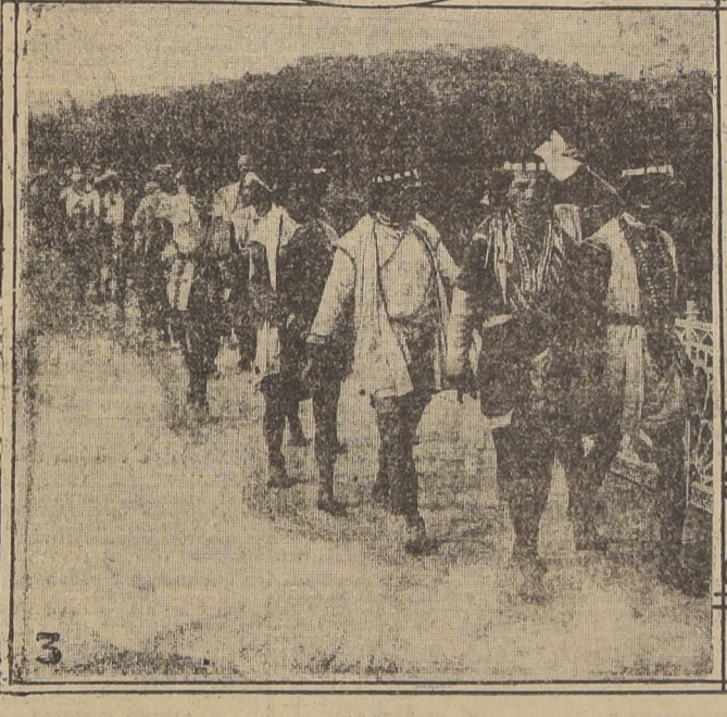
3. Tribus que se encaminan al culto religioso de Paihoku