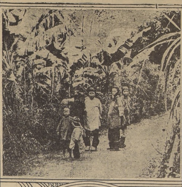
2. Una avenida de bananas