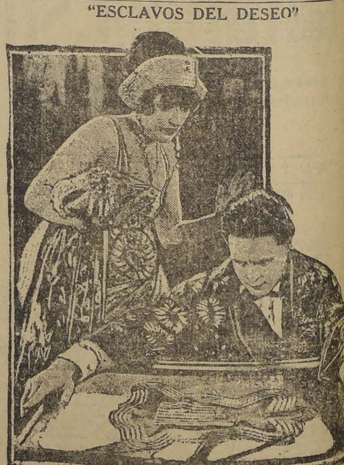
Pocas veces se había llevado a la pantalla una obra literaria, con más que tantas producciones de cine, que el cinematógrafo. En esta ocasión, los intereses de esta gran película, son por demás conocidos. Los actores, ellos son: Carmel Myers, George Walsh, y Bessie Love. En su papel de Comediantes, ellos realmente sobrecitan, un nombre mundano y Bessie Love, un amor imposible, y Bessie Love, que secunda admirablemente a los actores nombrados.