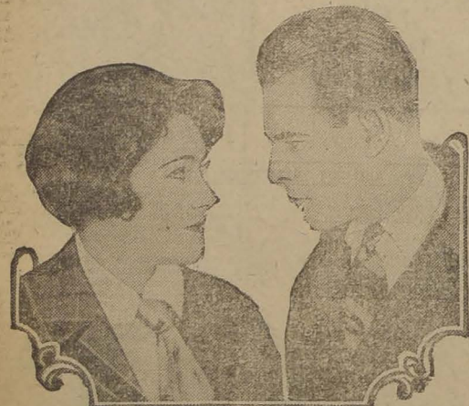
GLORIA SWANSON and LAWRENCE GRAY in a scene from the PARAMOUNT PICTURE “THE UNTAMED LADY” A FRANK TUTTLE Production

Un ambiente lujoso, de un sostenido buen gusto; un argumento nuevo con toques psicológicos; una presentación acertada de caracteres; una grandiosa y sensacional tempestad marina y un reparto valiosísimo