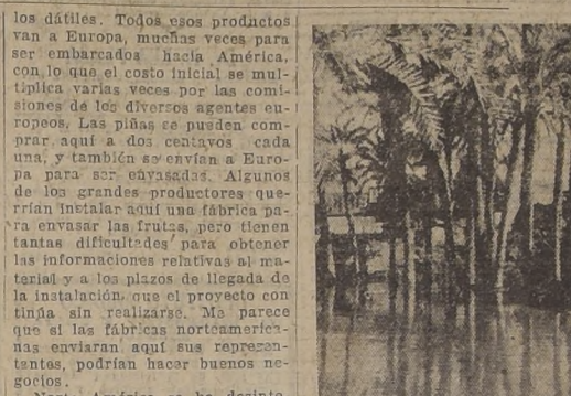
Un palacio en el Mossaka

A ORILLAS DEL RIO MOSAKA 9 de Diciembre de 1926. — "¿Por qué le pega a su esposa todas las semanas?" — "Porque lo merece." — "¿Quiere decir que cada semana ella hace algo que usted estima que merece que la golpee?" — "Sí, señor Administrador, contestó el negro al juez." — "Pero, entonces, ¿todas las semanas ella hace algo malo y usted invariablemente la sorprende?" — "Oh, no, señor. No la sorprende todas las semanas, pero sí muy bien que hay a lo menos una razón para que la castigue, la sorprende o no. Por lo tanto, cuando la pego puedo no saber qué es lo que ha hecho, pero ella lo sabe y está hasta." Esta interesante conversación, cuya filosofía es de lo más divertida— no digo exacta porque deseo conservar la estimación de mis amigos de ambos lados del Atlántico— me fué narrada por un oficial belga que había dejado el Ejército después de la guerra para dedicar sus actividades a la agricultura en el Africa, y que ha tenido muy buen éxito en su empresa. Me había invitado a pasar unos cuantos días en sus plantaciones, y después de una buena comida, las influencias combinadas de una copa de Kummel, un excelente habano y un poco de café frío, habían llenado nuestras almas con una beatitud propicia a las confidencias y descripciones. Me contó entonces acerca de la situación de esta región y sus naturales.