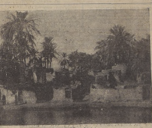
Antiguas chozas a orillas del río Mossaka

Continuamos hoy la serie de correspondencias cuya exclusividad para Chile tiene nuestro diario, en que el Conde Vasco da Gama, descendiente del famoso navegante portugués, anota sus observaciones a través de un viaje de exploración por el Africa Central. En crónicas anteriores el culto viajero había explicado el origen del Estado libre del Congo, había comentado las actividades del Rey Leopoldo, la política de expansión comercial belga, los intereses extranjeros en China y la Conferencia Internacional de Bruselas. La correspondencia actual toca problemas palpitantes de la vida centroafricana considerada en sus aspectos político y social. Como ya hemos dicho estas correspondencias sólo serán publicadas por un reducido grupo de grandes diarios del mundo entre los que se cuentan el "New York Times" y el "Daily Chronicle".