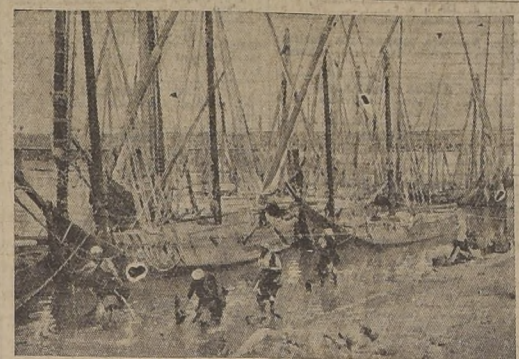
Vista de Likuba, a orillas del Mossaka

(CORRESPONDENCIA DEL CONDE VASCO DA GAMA, EXCLUSIVA PARA "LA NACION")