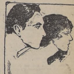
forma amena y simpática los caprichos femeninos, las debilidades masculinas y las modas de esta época charlestoniana, en la que surgen las serpientes tentadoras detrás de cada esquina. “Hojas de Parra” es una

Smith y a su marido don Adán, viviendo en Nueva York; aquí empieza la trama de esta comedia humorística, de gracia cautivante y de equívoca ironía, que va comentando en