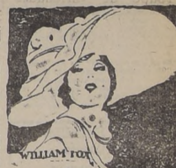
el muerto había sido un canalla, traidor como novio y como amigo, y que había sido herido en buena lid. En cambio, el hechizo, era el perfecto caballero, el hombre digno de su amor. Pero ya era demasiado tarde. “Fedora” se estrenará mañana en los teatros Setiembre, Carrera y Brasil, con espléndida orquesta y canto.

la heroína. Ha puesto en su rol alma y vida y seguramente gustará como las más ponderadas estrellas del cine. “Fedora”, es una obra de ambiente ruso, del tiempo de los zares. Ella es la princesa que quiere llegar a cualquier extremo para castigar al asesino de su novio, a quien creía un hombre ideal. Cuando ya tenía acordado el asesinato usando sus armas de mujer bonita, vino a saber que