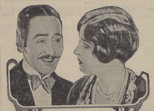
Adolphe Menjou and Alice Joyce in a scene from the Paramount Picture "The Ace of Hearts"

Un mundo de observaciones interesantísimas, de efectos bien buscados, de vida intensa, triste y real para por las escenas admirables de la notable comedia sentimental y a veces dolorosa, que se llama "El as de corazón" y que interpreta en forma original — para su temperamento y sus habituales condiciones — el incomparable Adolfo Menjou. "El as de corazón" es un trozo de vida, una manifestación de la hostilidad con que nos azotan los ojos acontecimientos, un trazo exacto de la existencia. Un moribundo detado de condiciones para triunfar