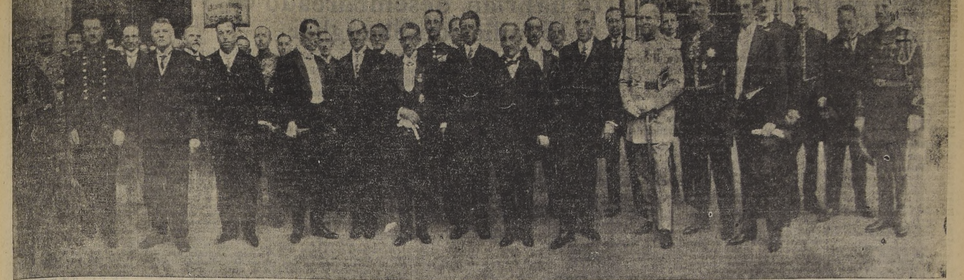
representantes extranjeros acreditados ante nuestro Gobierno