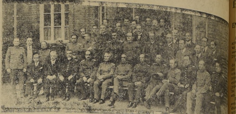
Ayer se efectuó el almuerzo íntimo que los antiguos jefes del Cuerpo de Carabineros ofrecieron a sus compañeros que han ingresado a la institución...