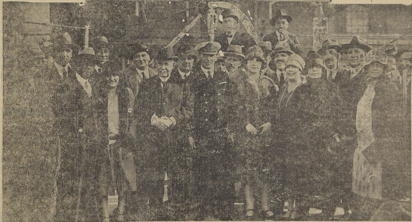
El viaje de nuestra Corbeta-Escuela al Paraguay, Uruguay y la Argentina, ha constituido la mejor demostración de amistad y comprensión. En los tres países, nuestros marinos han sido objeto de cariñosas manifestaciones. En nuestra sección cablegráfica

hemos informado a nuestros lectores de los agasajos que se les ha tributado, especialmente en Asunción, Paraguay. Las fotografías con que acompañamos estas líneas son: la Corbeta "Baquedano" en-