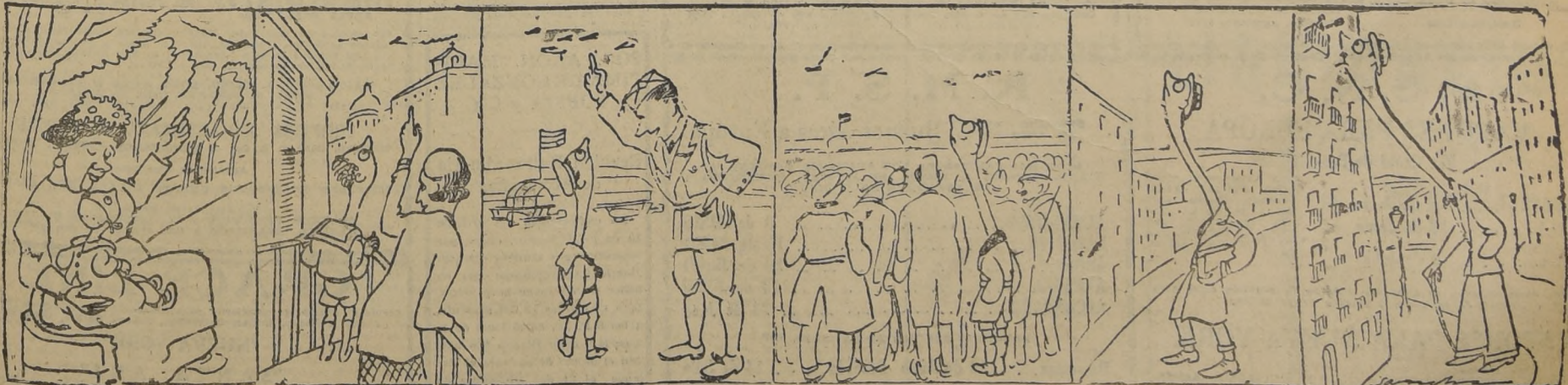
Desde su más tierna infancia, la niñera le señalaba a los aeroplanos; papá podría ir en cualquiera de ellos.