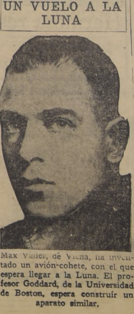
Max Vaucor, de Viena, ha inventado un avión-cohete, con el que espera llegar a la Luna. El profesor Goddard, de la Universidad de Boston, espera construir un aparato similar.

vas yerbas que entre ellas crecían, no se cerraba nunca y podía atravesarse por las gentes lo mismo que si hubiera sido un prado vecinal. Aún me parece que lo estoy pasando, una tempestad nocturna de niebla, en el momento en que a lo lejos surgía y se desvanecía rápidamente un fuego fatuo. Villiers, interrumpiendo la conversación de arte en que íbamos empeñados, se puso a cantar de pronto: