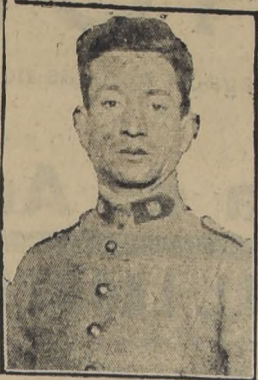
Imborrables de su incansable y fecundo labor. La muerte trágica de Navarrete...