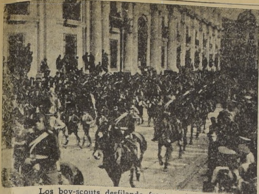
Los boy-scouts desfilando frente a la Moneda