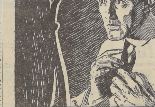
EL ESPEJO REVELADOR

En honor de Colombia Aproximándose la fecha del Aniversario de la Independencia de la República de Colombia, el Liceo de Niñas "Rosario Orrego" No 5,