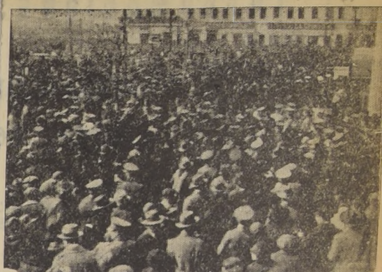
La multitud en espera de los cadetes en la Plaza Argentina

Los cadetes me pidieron que los acompañara hasta Chile y, accediendo a la invitación gentil de estos muchachos que tantas simpatías dejaron en aquella capital, no pude negarme y por eso llevo hasta Santiago. Hizo muy buenas impresiones de la prensa y tuvo frases cariñosas para Chile, su Ejército y sus instituciones, extendiendo al mismo tiempo que el duelo chileno había sido también duelo argentino.