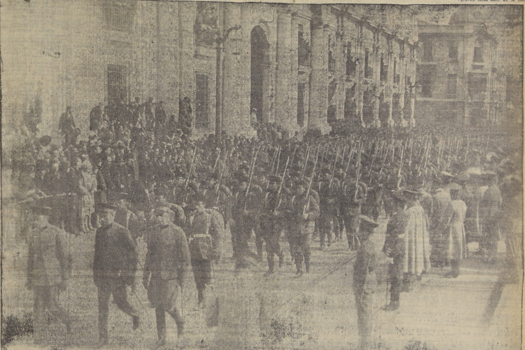
El desfile de la Escuela Militar ante S. E. el Vice-Presidente de la República

en medio de las atonadoras manifestaciones de simpatía que les tributaba la multitud, los bravos muchachos descendieron de los vagones. Los cadetes abandonan la Estación Después de vencer enormes dificultades, pues el público se eschuchaba contra las filas, vitoreando y aclamando a los cadetes, lograron éstos salir de la Estación