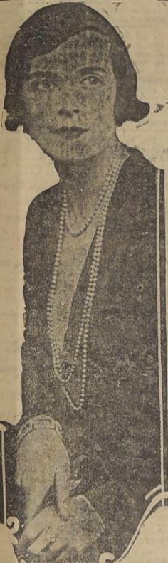
Lady Mountbatten, prima del Rey Jorge V. y favorita de la familia real, ha sido nombrada Cocinera Jefe del Casino de Hyde Park...