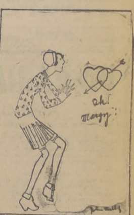
Margarita dice que el amor no vale por las pinturas, sino que por los pintores...