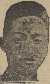
Ministro Wellington Koo