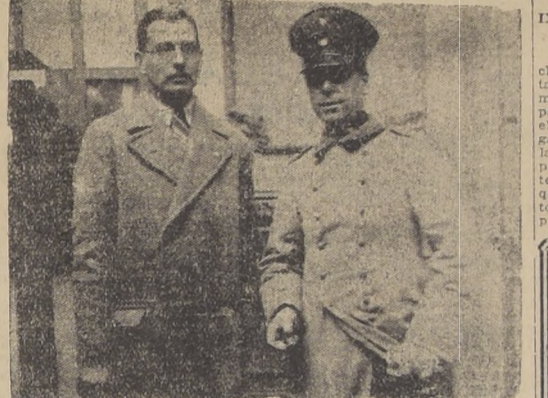
Durante la visita del Sub-Director de la Escuela de Policía de Mendoza