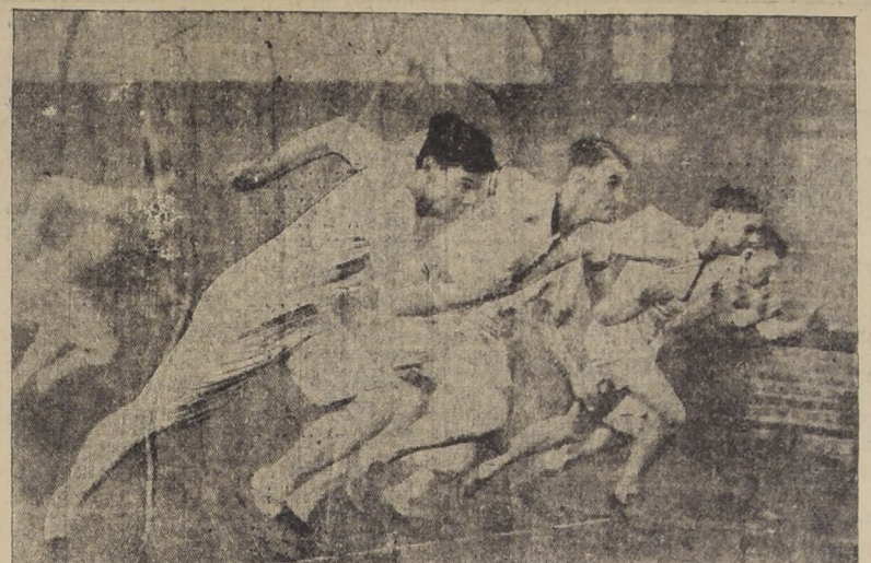
de ligereza de la Universidad de Cambridge, en un entrenamiento para el match que, unidos a los de Oxford, sostuvieron con los estudiantes americanos de Yale y Harvard, a quienes vencieron en siete pruebas de las doce de que constaba el programa.