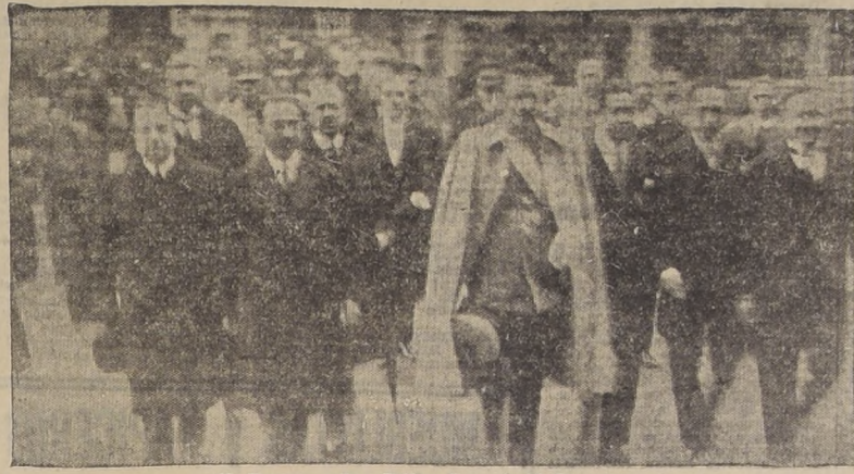
El Excmo. señor Ibáñez llegando al Congreso

El Excmo. señor Ibáñez tomó posesión de su cargo en un automóvil cerrado junto con el Ministro del Interior y el Educador, mayor señor Fuentes.