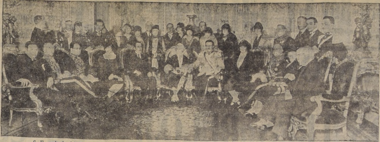
S. E., rodeado del Cuerpo Diplomático en el Salón de Honor de la Moneda, después de la ceremonia de la posesión del Mando