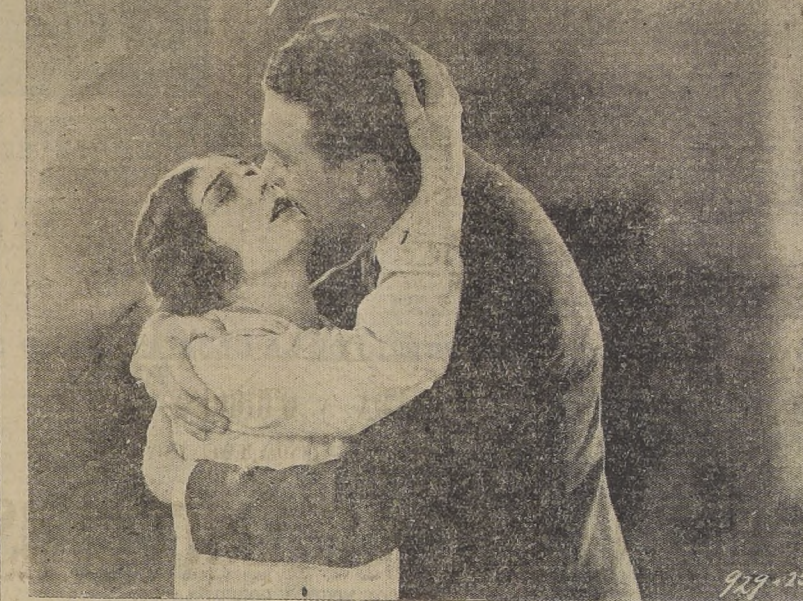
"CARMEN", POR RAQUEL MELLER, SE ESTRENARA PASADO MAÑANA EN EL PRINCIPAL. DRAMA INTENSO DE PASION, "CARMEN" REPRODUCE EL AMBIENTE PINTORESCO DE LA ESPAÑA LEGENDARIA DESCRITA POR MERIMEE

"SUBLIME Y PERVERSA" PELICULA PARAMOUNT DE LUJO, DE EMOCION Y DE INTENSA VIDA PASIONAL