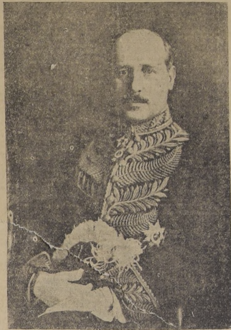
Excmo. señor Rafael H. Elizalde, Enviado Extraordinario y Ministro Plenipotenciario en Chile

En vías de comunicaciones, el Ecuador progresa rápidamente, ya que sus vías férreas, de 800 kilómetros, serán prontamente elevadas a 2.000 kilómetros, según