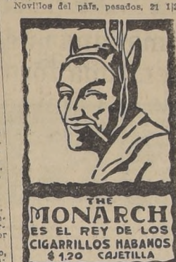
THE MONARCH ES EL REY DE LOS CIGARRILLOS HABANOS $120 CAJETILLA

Fábricas Unidas Americanas de Sombreros. SOMBREROS de fieltro en SEIS bonitos colores, a... $ 26.00. SOMBREROS de paño, desde $ 9.80, $ 10.50, $ 12.50, $ 13.60; $ 15.00 y... $ 18.00.