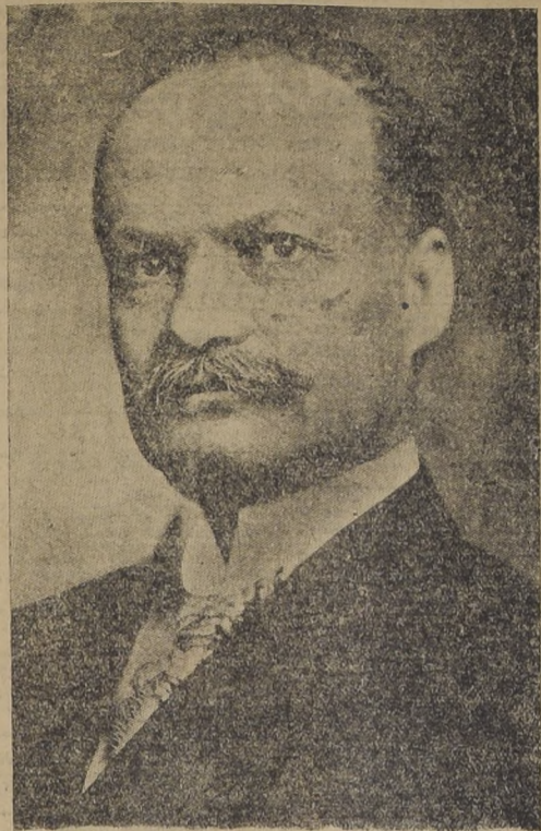
Excmo. señor Gonzalo S. Córdova, Presidente de la República