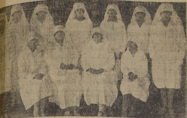
Un grupo de socias del Círculo de Enfermeras

La institución formada por socias enfermeras y que tiene como finalidad primordial la de prestar asistencia a los enfermos moribundos, ha estado las bases de su actividad en los resultados de su labor social.