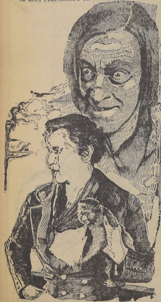
Estamos a pocos días del estreno mayor importancia que presentará "La bestia del mar", la obra del Victoria en la presente temporada.

SE ESTA PREPARANDO UN PROGRAMA EXTRAORDINARIO DE MUSICA PARA PRESENTAR ESTE GRAN ESPECTACULO