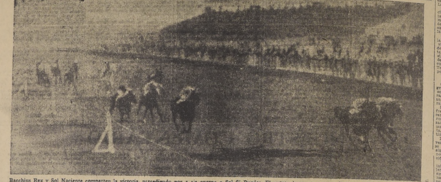
Bacchus Rex y Sol Naciente comparten la victoria, precediendo por 1 1/2 cuerpos a Sal Si Puedes. El cuarto lugar en empate, lo ocupan El Figaro y Oxford