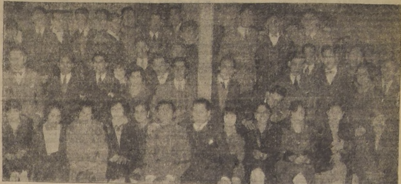
Parte de la concurrencia a la fiesta de anoche en la Sociedad Unión de los Tipógrafos

El mejor éxito han alcanzado las fiestas realizadas anoche y acentuándose en el Hogar de los Tipógrafos, ubicado en la calle Eleuterio Ramírez.