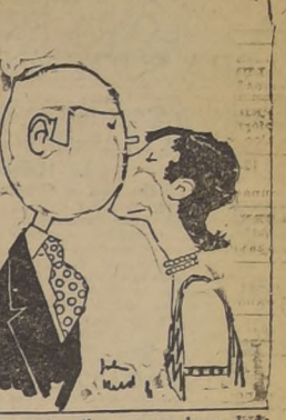
Margarita dice que un beso dado en un extracto, vale por dos dados en la casa