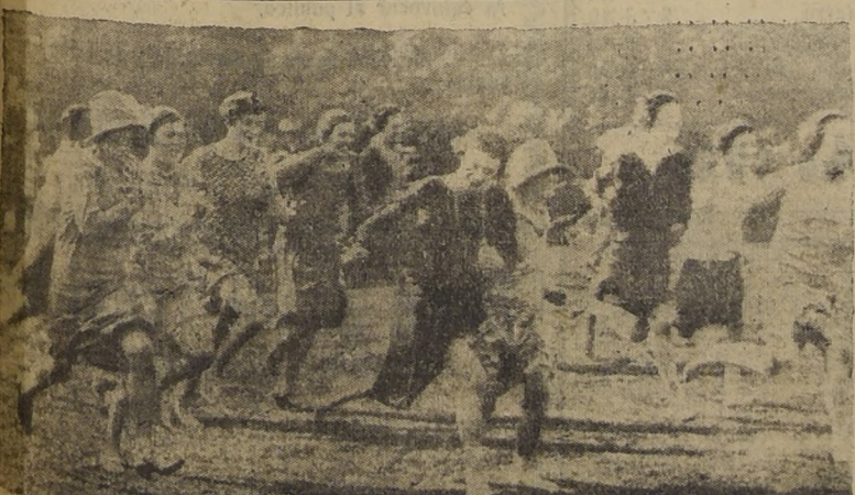
Una "carrera de las madres", en una Fiesta de Primavera en Inglaterra. Todo cambia. Nos basta pensar de imaginarnos la figura que habrían hecho nuestras madres en ocasión parecida, para darse cuenta de toda la diferencia que media entre las costumbres de ambas épocas.