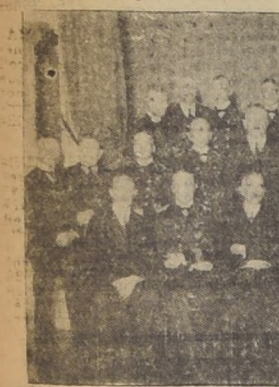
En el almuerzo ínti

Los marinos del crucero alemán "Emden", recibieron ayer una entusiasta bienvenida a su llegada a Valparaíso de parte de la colonia alemana y de los marinos de la Esquadra. Tal como se había anunciado, las nueve de la mañana, el "Emden" entró al puerto, saludando