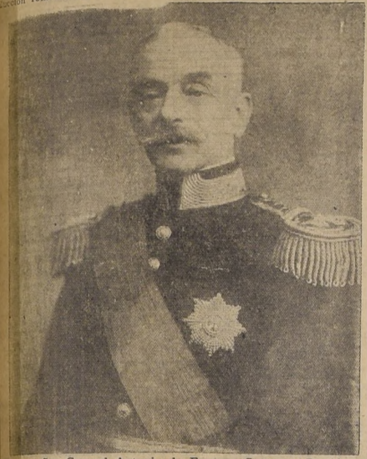
Excmo. señor General Antonio de Fragoso Carmona, Presidente de la República de Portugal