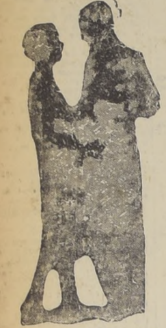
EN EL MOMENTO DE ENLAZAR A LA SEÑORITA PARA EMPEZAR LA DANZA

nuevo hay un rumor de besos y en cada frase un madrigal de amores. Renovación de todas las pasiones paganas, la flauta dulce brío, y el nuevo susurro con potente brío, y entre el rumor de fiestas del follaje de los bosques umbríos, parece que escuchas la risa de las hadas, que con escucha todo celebran el arribo de la estación florida. Y el triunfo del amor, se impone y manda: en cada corazón hay un volcán, que el pecho apenas a guardar alcanza. Por tal razón, ellos y ellas se buscan, con renovada obstinación ahora, con la Primavera, el frenesí de la danza, del baile moderno y civilizado, expresión genuina de la época que vivimos hoy, plena de dinamismo, de inquietudes, de deseo de gozar, de vivir plenamente la vida, corta vida del hombre de este siglo.