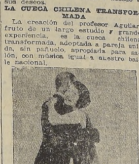
EMPEZARON BAILANDO PARA TERMINAR EN CLINCH...