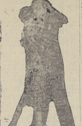
ESTILO CORRECTO Y DE MODA

Y EL BAILE SE IMPONE... Enlazados, siguiendo el ritmo galante de la pieza que desgranará la orquesta, ellos y ellas se alegran rumbos, que cantan en el arroyo cristalino, en la flor que se mece al soplo suave de la brisa, en el celo que muestra sus más bellos colores, y la risa que es pura, que es caricia, que es encanto.