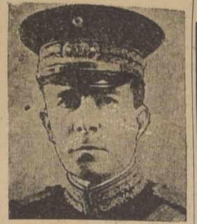
General Francisco Serrano

del Presidente Calles y probablemente trabaja con el general Aguirre para impedir que el general Gómez lleve a cabo sus proyectos. — (U. P.)