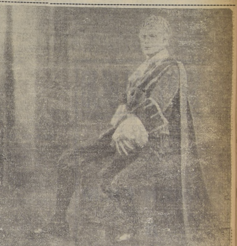
DINO BORGIOI, famoso tenor que cada presentación en nuestro Municipal es un clamoroso éxito, mañana cantará el Barbero de Sevilla, en cuya obra obtiene siempre grandes triunfos. Este celebrado artista es exclusivo de Columbia Phonograph Co. de New York.