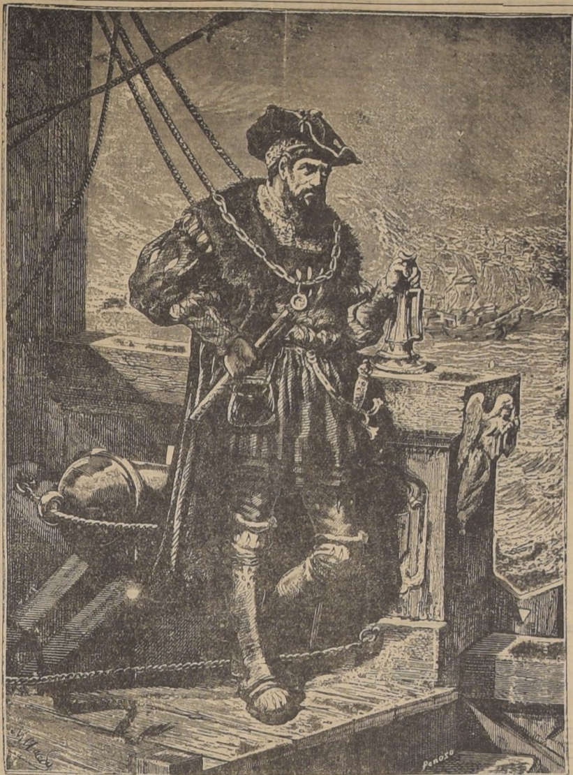
El gran navegante Vasco de Gama, a bordo del navío "San Gabriel"