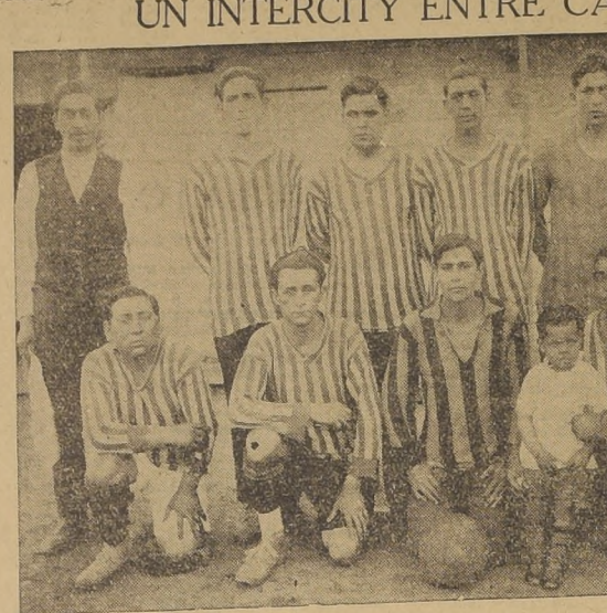
El equipo de los canillitas santiaguinos en la cancha del Santiago F. C. ubicada en la Avenida Independencia...

LOS LANCES OFICIALES DE MAÑANA LIGA CENTRAL DE FOOTBALL DE SANTIAGO CLUBS CANCHA HORA ARBITRO DIRECTOR