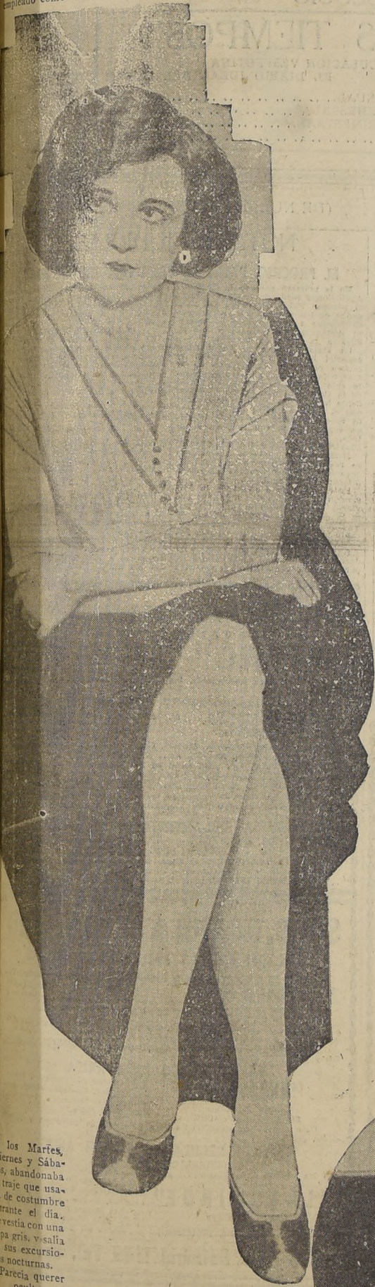
LA ESPOSA DE BAKER

Pero, mientras tanto, y hasta que la justicia no decida algo, Baker se encuentra impedido de seguir en sus dobles ocupaciones: la honesta y desembozada de las horas de la luz, y la delictuosa que se oculta en la noche.