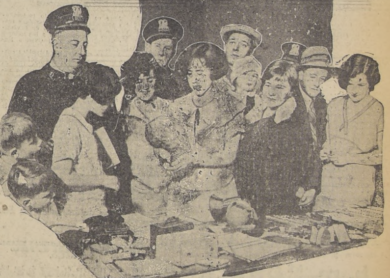
GRUPO DE PERSONAS QUE EXAMINAN LOS OBJETOS DE SU PROPIEDAD

Era, según dicen los anales judiciales, uno de los criminales más pintorescos. Durante todo el desarrollo del proceso, mantuvo una sonrisa de tranquilidad, que contrastaba con la de su mujer, que no podía resol-