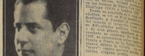
Capablanca ha elevado el nivel del ajedrez...