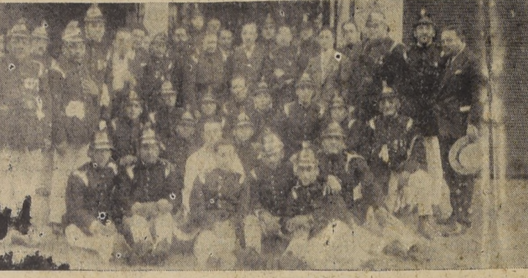
La oficialidad saliente, que fué festejada ayer