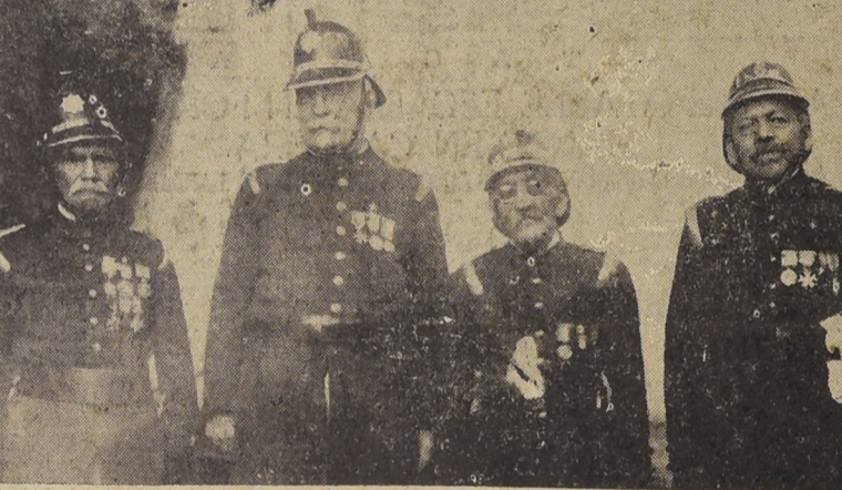
Los voluntarios más antiguos de la 6.ª Compañía

De acuerdo con la citación expedida por el secretario general, ayer se reunieron en sus cuarteles, en la forma que se ha indicado, el Cuerpo de Bomberos de Santiago, con el objeto de elegir la oficialidad que dirija los destinos de la institución durante el año venidero.