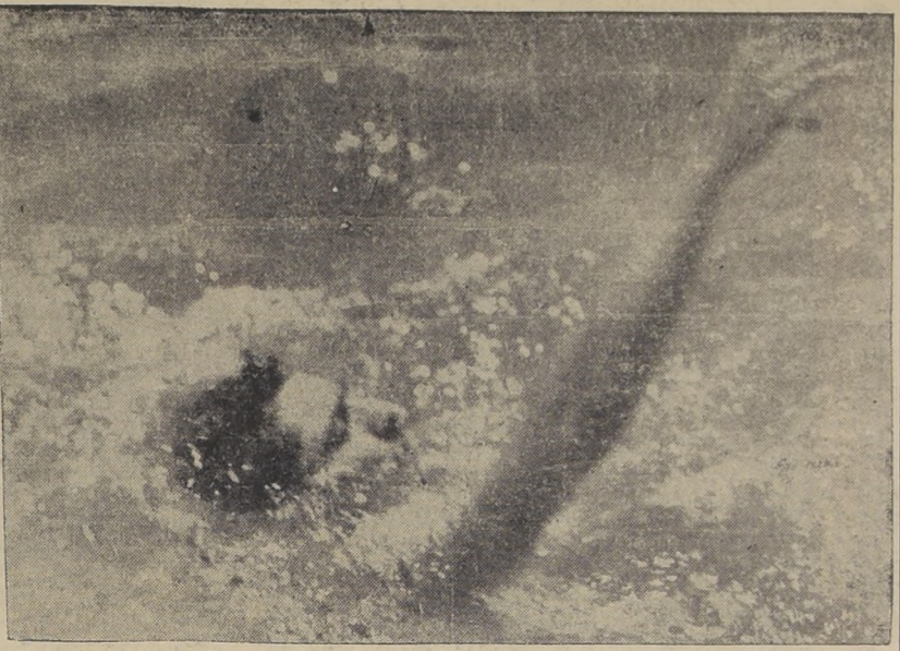
Hernán Téllez, que intervendrá en los 100 metros espalda, luciendo su impecable estilo crawl espalda

La práctica de la natación, a pesar de ser de época reciente, ha adquirido en nuestra capital, un auge muy superior a cualquier otro deporte en el mundo. En la actualidad, las piscinas de natación, que en la actualidad se hacen estrechas y a menudo se practican tan solo como un deporte de recreación, en la actualidad cuenta con más de 700 socios todos ellos buenos nadadores.