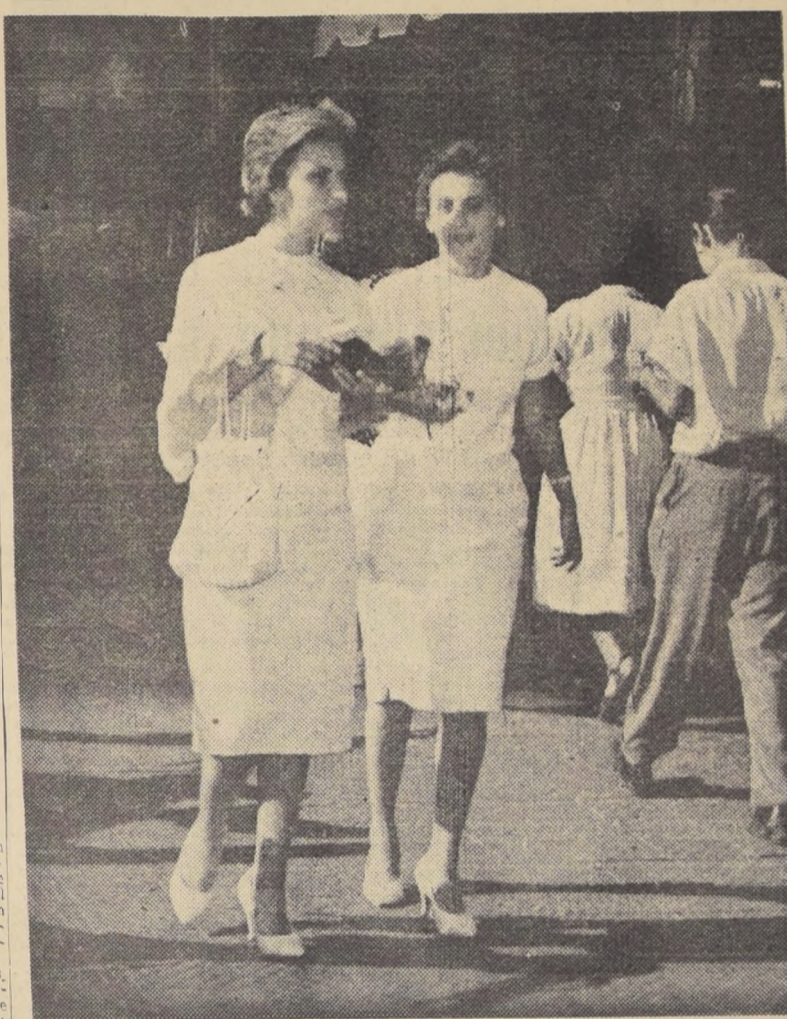
Continúa con éxito nuestra sección "Sorprendidas en..." que tiene como premio una ampliación de la foto para las personas que posan, sin saberlo, para LA NACION. Las simpáticas damas que aparecen en el grabado fueron sorprendidas en Ahumada, por nuestro reportero gráfico, y pueden pasar por LA NACION, Agustinas 1268, a retirar las copias de la lista.