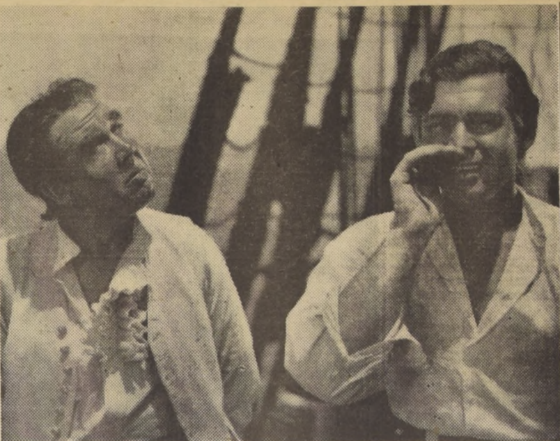
RUGIDOS DE ANTAÑO.— A partir de mañana, la Metro presentará siete películas correspondientes a la época dorada de su León. Junio al "Mago de Oz"...