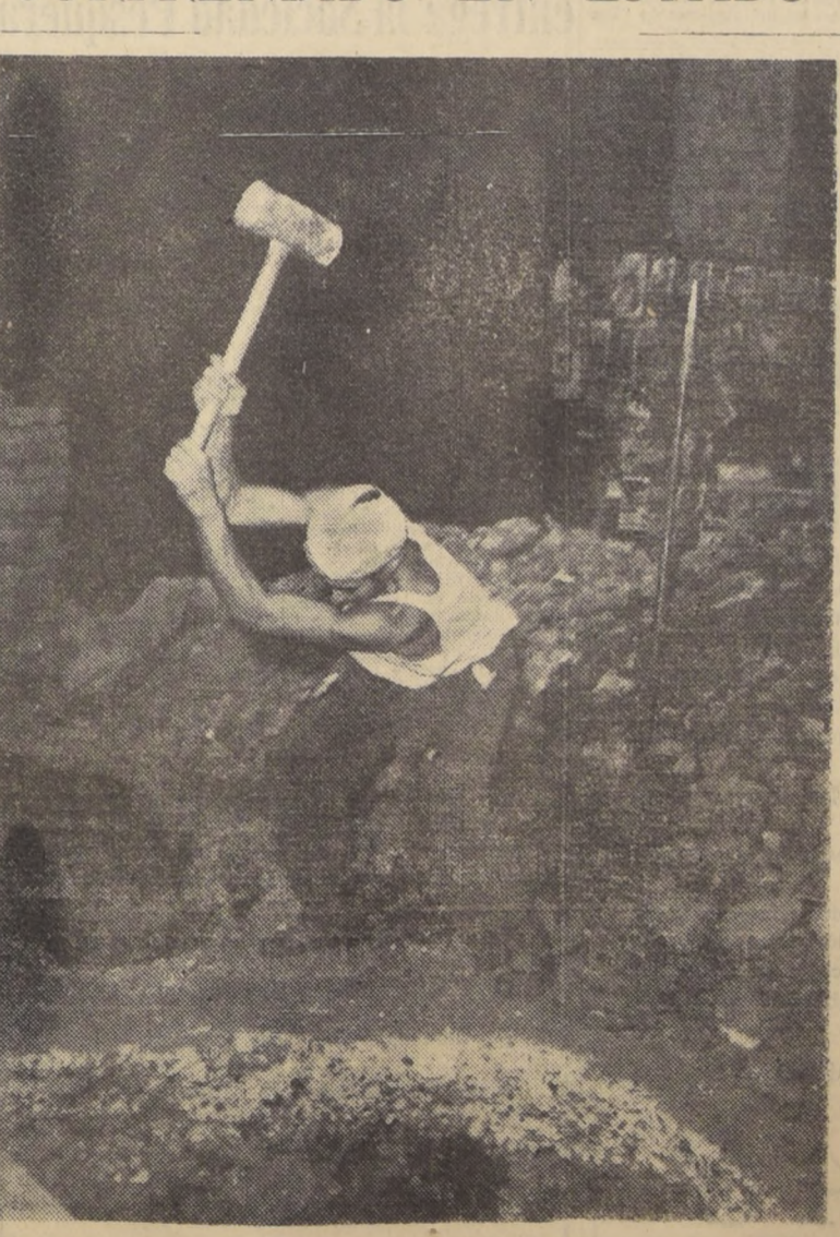
Abriendo una brecha en el pavimento con un "combo" de cuarenta libras y con un promedio de cuarenta y dos golpes por minutos, sorprendió LA NACION, en la calle Estado, a este auténtico artista del chuzo, la diaria labor de la tarde, este obrero sacaba su tarea aprovechando "la fresca" de la tar-