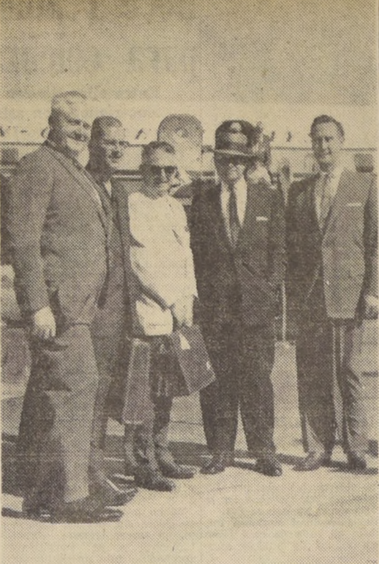
JEFES DE LA ESSO.— Procedente de Buenos Aires, llegaron ayer a Santiago, el tesorero y el asistente del tesorero de la Esso Standard Oil Co., de New Jersey. En Los Cerrillos fueron recibidos por altos jefes de esa compañía en Chile.

El Presidente del Eximbank, agradecido en breves y cordiales palabras las demostraciones de afecto que había recibido de parte de los Jefes oficiales, empleados y obreros de MADECO. DECLARACIONES DE MR. WAUGH.—"Estoy feliz de haber conocido una planta industrial, tan limpia, ordenada, con mucha gente joven y