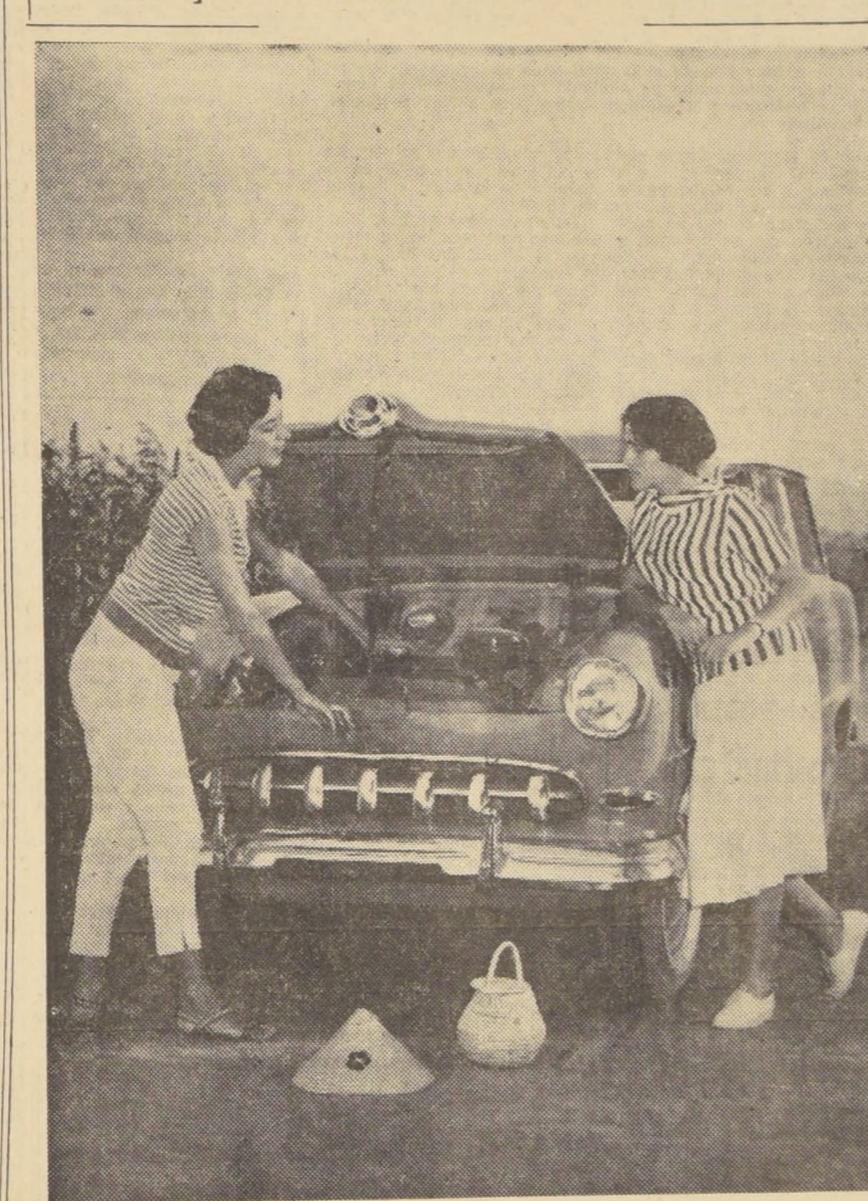
En el camino a Melipilla, LA NACION sorprendió a estas jóvenes cuando tenían serios problemas con el automóvil en que viajaban. El desperfecto que las detuvo a medio camino, parece no preocuparlas seriamente.

TAQUIGRAFIA CURSOS A CARGO DE TAQUIGRAFOS DEL H. SENADO Sistema Rieman, Gregg y Parlamentario. DACTILOGRAFIA Escuela de Taquigrafos Profesionales. HUERFANOS 725 5º Piso — FONO 31981. UNA PROFESION ENSEÑADA POR PROFESIONALES