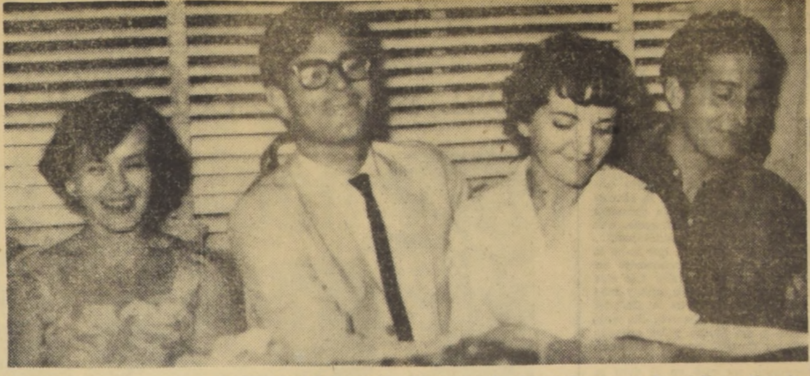
SU GRAN AVENTURA. - La intenciva práctica escénica que exige la reforma de la Escuela del ITUCH a los futuros actores...