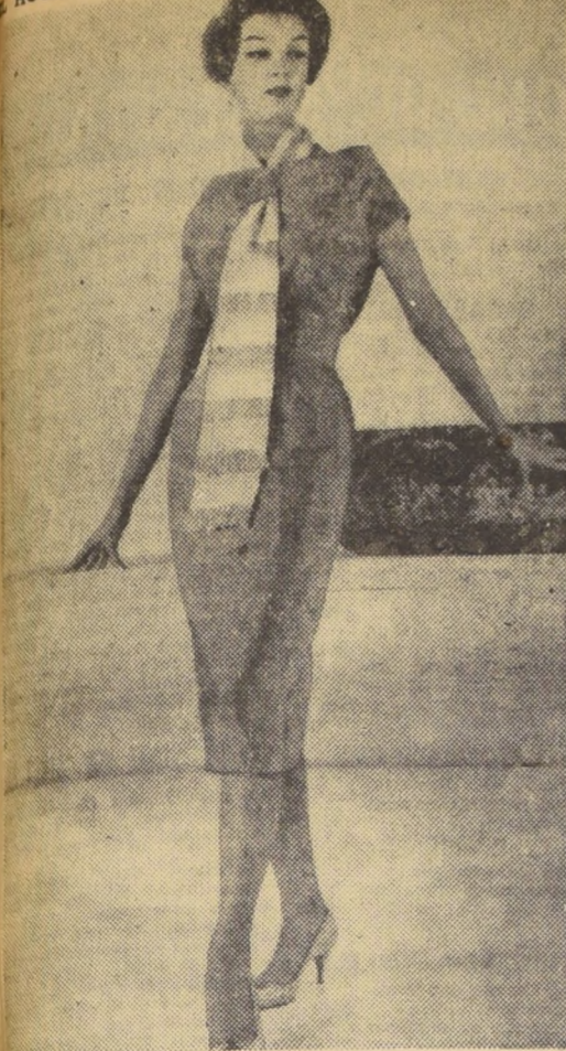
Modelo italiano diseñado por las hermanas Fontana. Está ejecutado en shantung de seda rosado con la corbata en rosa y blanco.