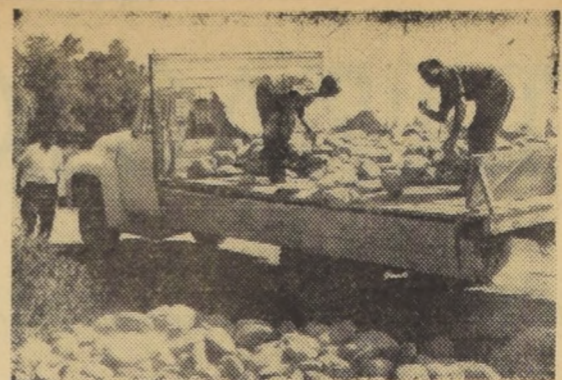
CURICO.- Camionadas de piedras se transportan diariamente para el lugar donde se edificará una nueva y moderna población en Curico...