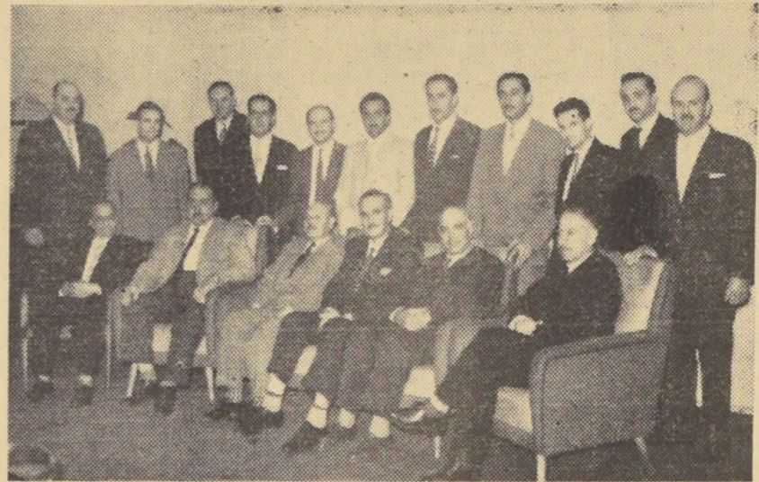
TEMUCO.- A diversos actos que revistieron lucidos contornos dio lugar en esta ciudad la celebración de un nuevo aniversario de la República...