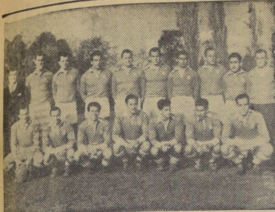
EQUIPO DEL STADE.— El cuadro de honor de rugby del Stade Français, que ayer ganó sin apelación al Grange School, por 33-0, en la competencia oficial.