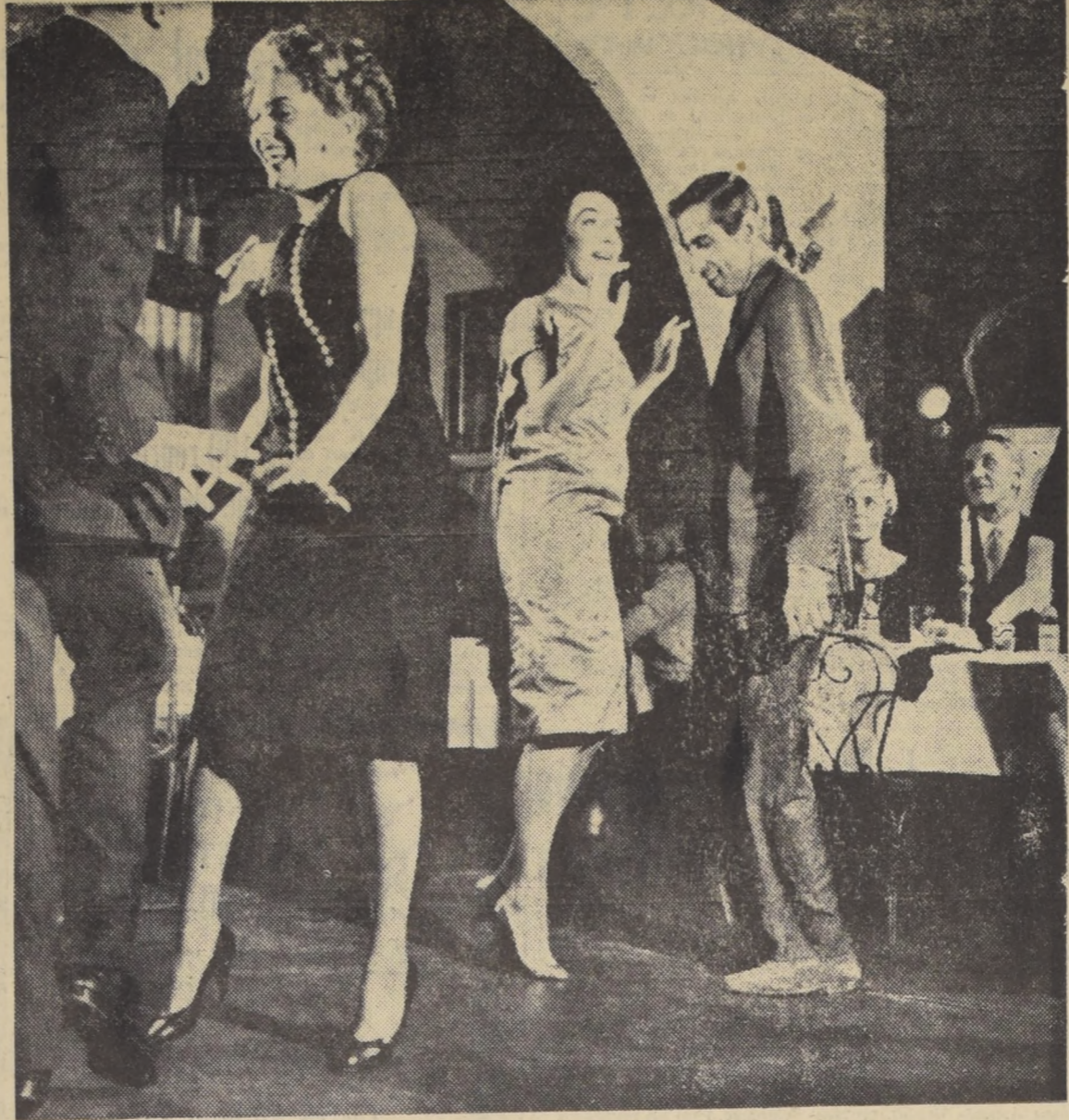
ESTOS SON LOS RITMOS que desea la Juventud soviética, aunque le desagrada al Kremlin.