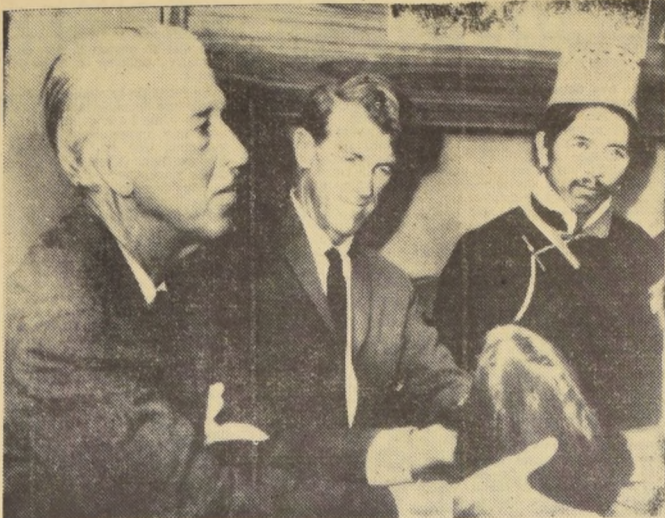
HOMBRE DE LAS NIEVES: Marlin Perkins, director del Zoológico de Chicago, y el famoso explorador británico Sir Edmund Hillary, aparecen en una conferencia de prensa, explicando el curioso hallazgo de un cuerpo perteneciente al llamado "abominable hombre de las nieves", que habitaría en el Himalaya.

Para ayudar a su hermano, Kennedy designó Subsecretario de Justicia a Byron White, un viejo amigo y ex estrella del fútbol norteamericano. White, que ejerce la abogacía en Denver, dirigió la Organización de "Ciudadanos pro Kennedy" durante la reciente campaña electoral.