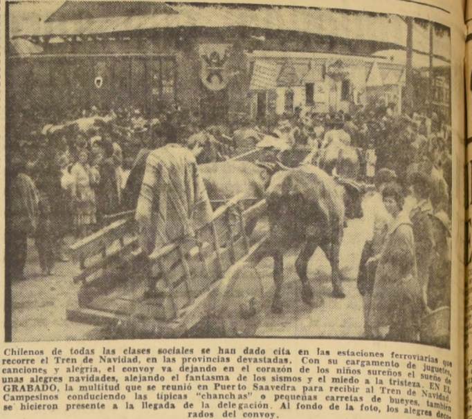
Chilenos de todas las clases sociales se han dado cita en las estaciones ferroviarias...