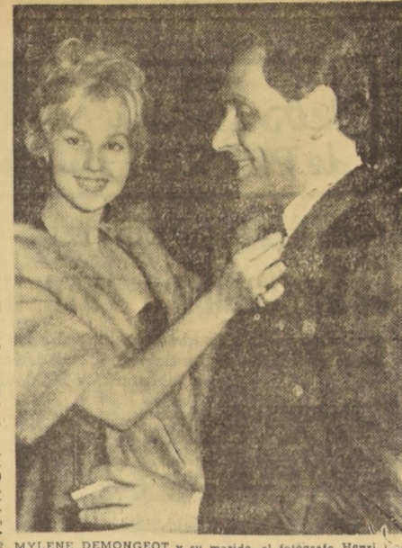
MYLENE DEMONGEOT y su marido, el fotógrafo Henri Coste...