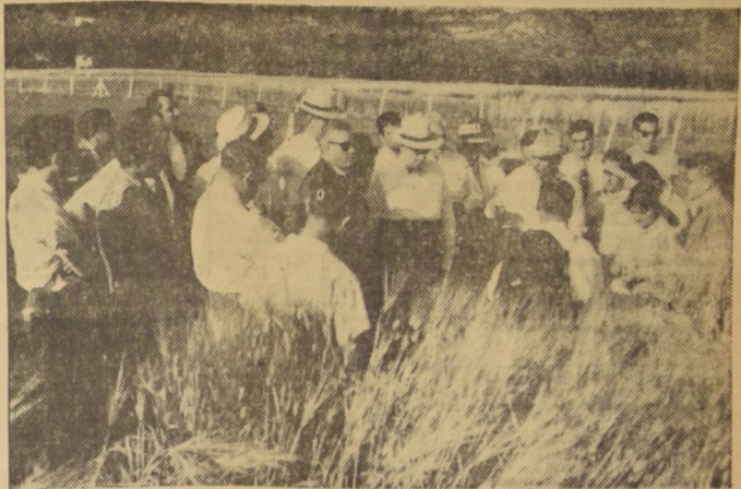
EL PRESIDENTE Y EL VICEPRESIDENTE DE LA SNA visitan la Estación Experimental y escuchan de labios del presidente y director de este centro de investigación, detalles de la labor que allí se realiza.

También estos productos son materia de trabajos especiales de los técnicos de la Estación Experimental de la Sociedad Nacional de Agricultura. La labor que se desarrolla en torno del maíz puede compararse a través del siguiente desarrollo, líneas endoceras, jardines, cruzamientos y ensayos de rendimiento.