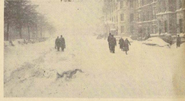
NUEVA YORK DE BLANCO: Furiosas tormentas de nieve están azotando Nueva York. Esta ha sido la causa principal del accidente de aviación ocurrido hoy. Aquí vemos el aspecto que ofrecía el Central Park, hace pocos días.

PALM BEACH, Florida, 16 (UPD).— Un recluso de un sanatorio para enfermos mentales, a quien se le conocía como "hombre bomba", para dar muerte al Presidente Electo, John F. Kennedy. El anuncio fue hecho por las autoridades federales. El detenido dijo a las autoridades que Kennedy es un "hipócrita" en cuanto a la religión, citó un discurso pronunciado durante la campaña política en el Estado de Texas, en el cual Kennedy dijo que colocaría su responsabilidad hacia la nación por encima de sus obligaciones hacia la Iglesia y si es que tenía que hacer una selección.