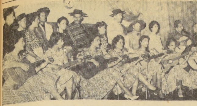
La Escuela de Cultura Artística N.º 7 de Santiago realizó ayer su presentación de fin de año en el auditorio de Radio Minería con un nutrido y bien logrado programa en el que se interpretó desde "El aldeano alegre", de Schumann, hasta nuestra alegre cueca. Participaron conjuntos y solistas destacados, alumnos de los diferentes cursos. En el grabado, actúa el conjunto de guitarras de la Escuela.