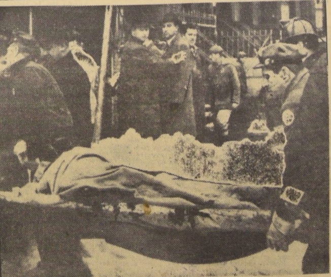
BROOKLYN. — Compungido rostro muestran cuatro transeúntes que se detienen a observar a uno de los cuerpos de las víctimas del trágico accidente de aviación ocurrido el 16 aquí. Una de las máquinas que protagonizó el siniestro cayó en llamas y provocó dantesco incendio en una amplia área. El mayor número de víctimas se registró acá.