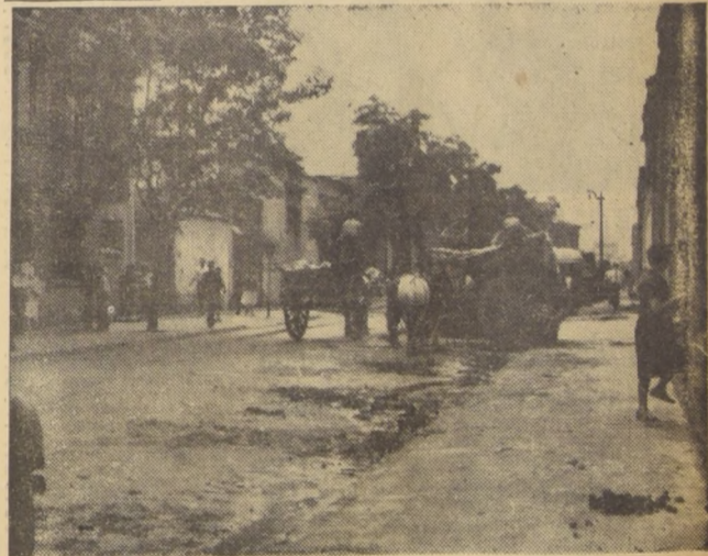
El grabado es una elocuente demostración de lo que a diario se observa en la Vega Central y sus alrededores. Desperdicios, restos de forrajes y toda clase de hortalizas y frutas descompuestas, dejan una huella de malos olores y de moscas que invaden las residencias del sector. Mientras el Servicio Nacional de Salud culpa de estos males a la Municipalidad, esta se queja de la falta de colaboración de los locatarios. Entretanto, el problema se mantiene latente y el peligro para la salud pública se acentúa. La foto corresponde a un sector de la calle Lastra, casi esquina de Independencia.— (Información pág. 6)