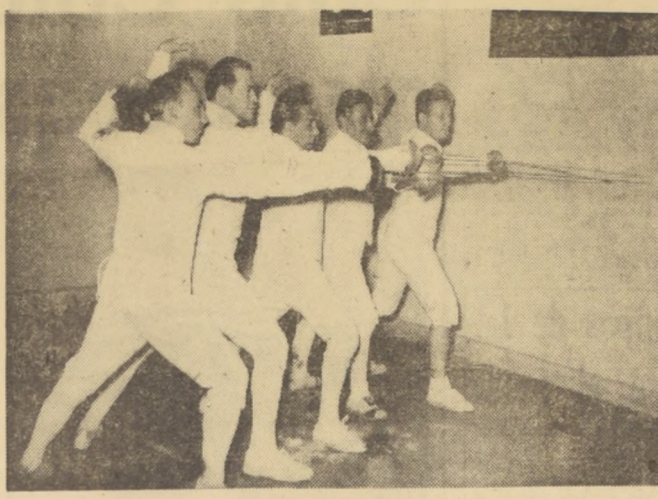
El torneo se inicia mañana en la Escuela Militar.