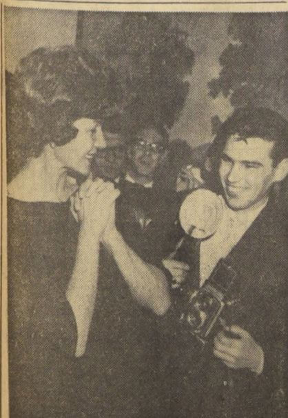
ROMA — La actriz Rita Hayworth celebra un chiste del fotógrafo durante una conferencia de prensa. Rita se detuvo en Roma, en viaje a España, donde filmará "The Oldest Confession". El film lo dirige su esposo James Hill.

RETTIG: Las provincias de Valparaíso y Aconcagua, recorrerá en jira Raúl Rettig. Visitará después Magallanes, Puerto Montt y Valdivia. A Valparaíso partirá el 14 de enero (Pág. 3)