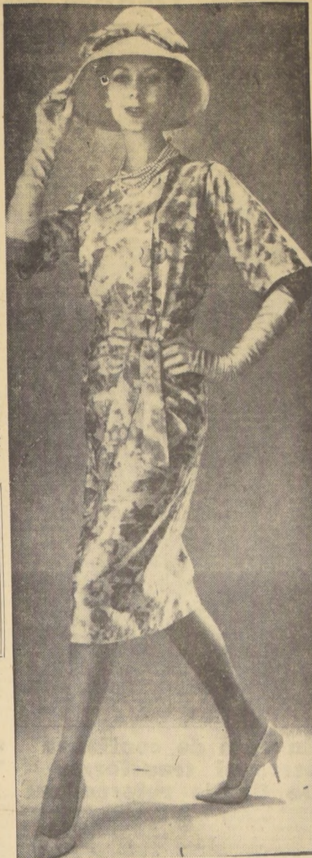
Vestido en surah blanco, estampado amarillo y beige, muy práctico y elegante, para todo el verano. Es un modelo de MAGGIE ROUFF.