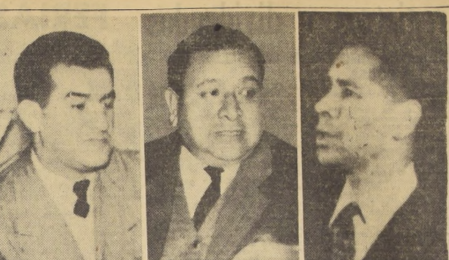
VIOLENTOS INCIDENTES EN REUNION DE DIRECTIVAS DE LA FIFCH: