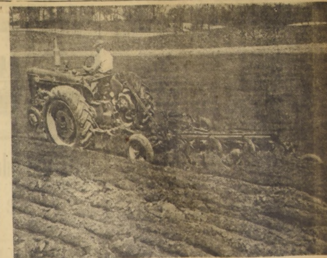
Ejemplo de la formación de prismas bien definidos, continuos y de ángulo correcto, lo cual asegura fragmentación óptima y lista para recibir el riego con verdadera economía.

Después de haber establecido la capa de laboreo es necesario conservarla, ya que con el tiempo ésta decae y disminuye. Bajo la acción de las cosechas sembradas a voleo, y de los que hay que enterrar la semilla, como el trigo y la avena, las partículas se debilitan, disgregan y separan, y la capa laborable se va deteriorando a medida que la materia orgánica desaparece. Las lluvias intensas o prolongadas acentúan su decaimiento. En los terrenos anegados, la acción del agua y la débil cohesión que existe entre las partículas, afeoran su estabilidad y producen su disgregación total. Asimismo, el peso de la maquinaria agrícola, el pisoteo del ganado, la labranza inadecuada y el exceso de labores perjudican también, perjudican la buena granulación del terreno y lesionan por lo tanto la capa de laboreo.