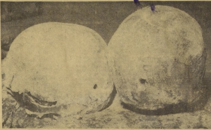
LAS CALAVERAS DE DARDIGNAC.— En el grabado (de Víctor Rojas), se observan las perforaciones a bala que presentaban las dos calaveras encontradas ayer en Dardignac 81. En la de la derecha, el barro oculta otra perforación de un proyectil de calibre 7. Se desearía el suicidio porque las calaveras presentan en la región frontal los huesos destrozados, al estallar cuando salían los proyectiles. (Más informaciones y fotos en la página 3.)