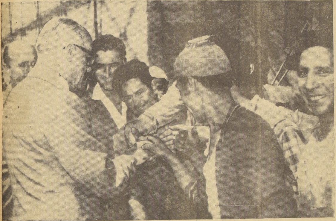
CON SENCILLEZ y cordialidad, departió con los trabajadores de la planta de Cementos Bío-Bío, durante su visita a esa usina, que se constituirá en uno de los pilares de la reconstrucción y progreso de numerosas provincias