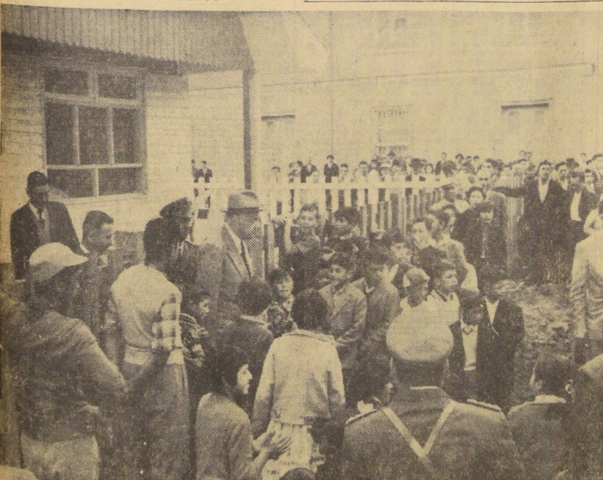
RODEADO DEL AFECTO DEL PUEBLO.— S. E. el Presidente de la República recorrió la localidad de Lebu, rodeado del afecto del pueblo, en la jira al sur del país que finalizó ayer. En el grabado, lo muestra avanzando por una de las calles de esa localidad, seguido de una compacta muchedumbre compuesta por gente modesta, que le testimonia su afecto y respeto.