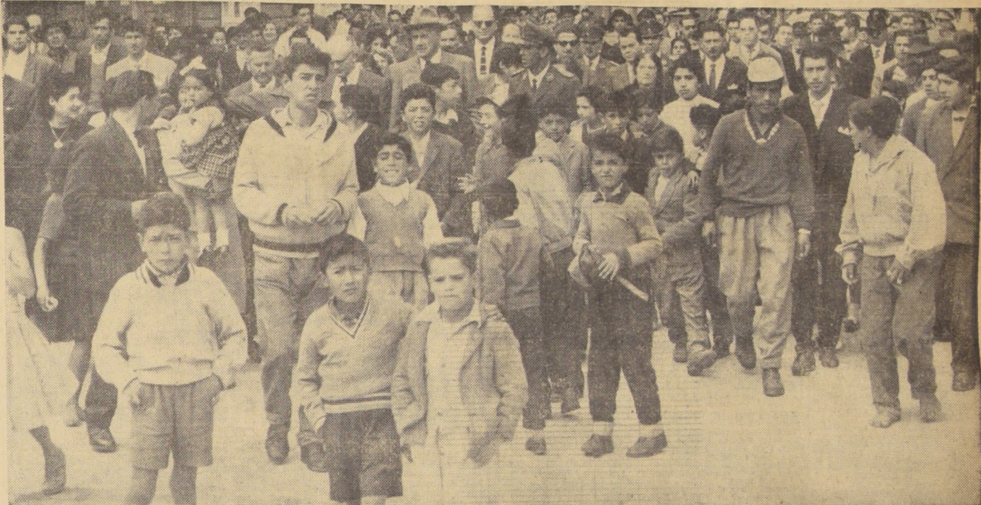
EN POBLACION "EL ESTADIO".— El Jefe del Estado no tan sólo visitó los más importantes centros industriales en su reciente visita. También alcanzó a la nueva población "El Estadio", de Lebu, a conocer como viven centenares de modestos empleados y obreros de esa región. En el grabado, se le ve acompañado de los moradores de dicha población.

LLEGADA A LA CAPITAL.— El Presidente Alessandri llegó a Los Cerrillos a las 15,40 horas, siendo esperado por funcionarios del Ministerio del Interior, de la Cancillería, así como por numeroso público que le aplaudió largamente. S. E. agradeció estas demostraciones de afecto saludando con la mano en alto y luego se dirigió hacia su automóvil particular, que le esperaba fuera del edificio principal del aeropuerto, para conducir hasta su residencia privada. — (MAS INFORMACIONES Y FOTOGRAFIAS EN PAGINA 15.)