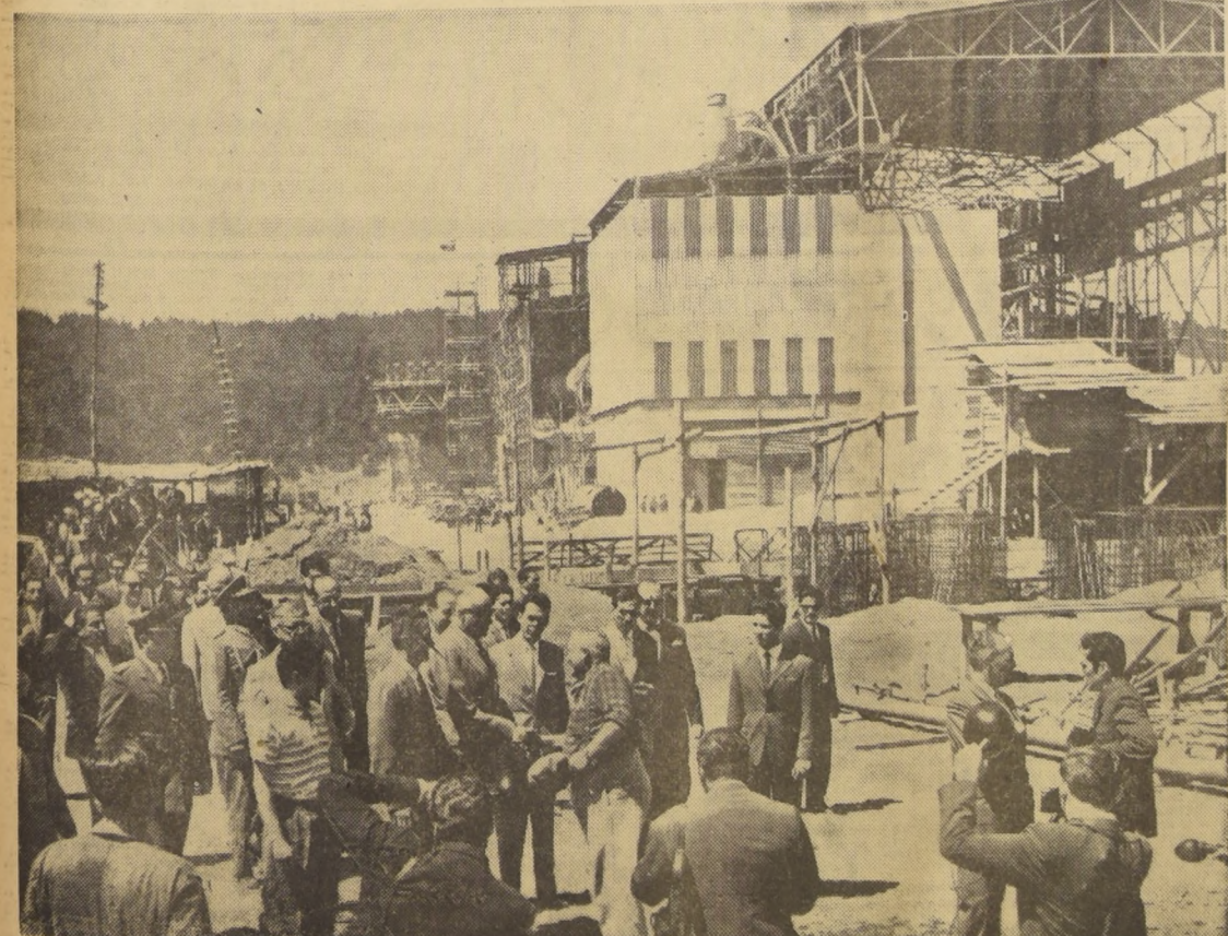
EL PRESIDENTE de la República aparece en este grabado recibiendo los primeros saludos de ejecutivos y trabajadores de la Planta, cuando arriba a la usina