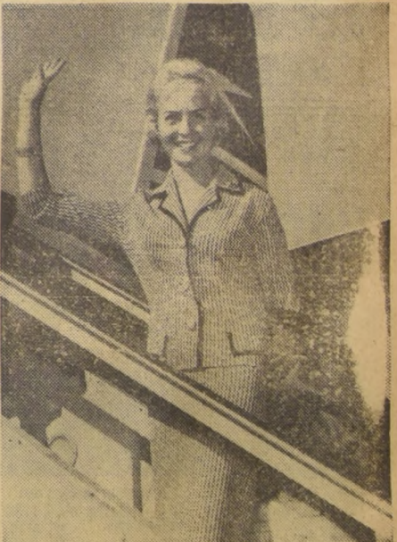
VIA BOAC REGRESO a su patria la popular actriz del cine alemán Germaine Damar, protagonista de la cinta "Las piernas de Dolores", que permaneció algunos días en nuestro país. Antes de abandonar Los Cerrillos, Germaine dejó un beso y un abrazo para todos los chilenos, que son encantadores, según dijo textualmente.