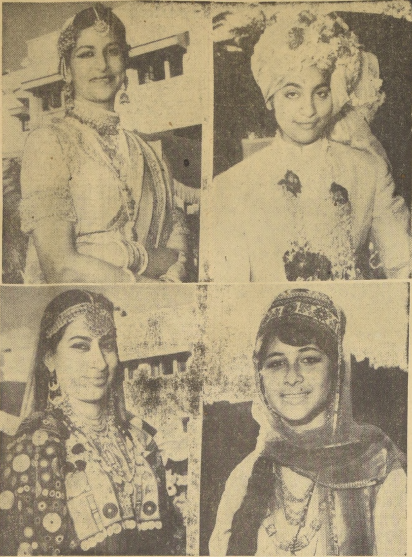
SE ADORNARON PARA ISABEL.— Joyas, turbantes de fantasía, collares y brazaletes, tules y ropas flotantes, lucieron las mujeres de Karachi (Pakistán), para recibir a la Reina de Inglaterra, en su reciente visita a ese país. Cuatro representantes de diversas regiones del Pakistán, posaron sonrientes para la lente fotográfica, durante la visita real.

mitieron filmar en relieve el encuentro del óvulo y de la célula masculina. El autorizado órgano "Le Monde" dijo el respecto: "Ninguna de las etapas normales de la fecundación—la penetración del espermatozoides en el óvulo, la división celular explosiva y el desarrollo del embrión que a los 29 días debería estar notablemente estructurado—puede ser formalmente identificada en las imágenes presentadas. El óvulo virgen, cuando es sometido a cambios de ambiente, presenta frecuentemente fenómenos de división y de activación por partenogénesis, y es de preguntarse si no son precisamente estos fenómenos los que fueron filmados. En cuanto al embrión de 29 días y de dos centímetros, éste se mueve en una obscuridad imprecisa, y ni aun el observador más hábil lograría hallar en él alguno de los órganos primordiales, como la cabeza o las piernas, que permitirían identificarlo". El profesor Petrucci reaccionó contra estas críticas. "Mi experimento—declaró después de haber señalado que él es un cirujano y sus adversarios biólogos—no consiste en querer crear la vida. Yo trato sencillamente de imitar. La finalidad de mis investigaciones es la de conocer mejor los factores que determinan el sexo del niño por nacer y ciertos fenómenos que conciernen a la intelerancia de los trasplantes. Ciertamente, sólo deseo hallar un medio que permita a los padres obtener niños o niñas, a su elección".