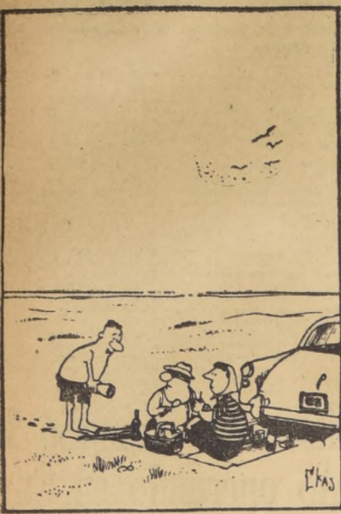
— ¿Me podrían cuidar la toallita, por favor? —