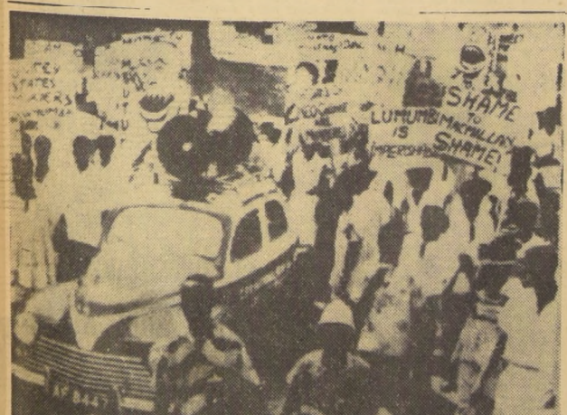
ACCRA (Ghana).— Cientos de manifestantes marchan hacia la Embajada de Estados Unidos para protestar por el asesinato de Patrice Lumumba. Ellos hicieron destrozados en el edificio y quemaron documentos de la Embajada.