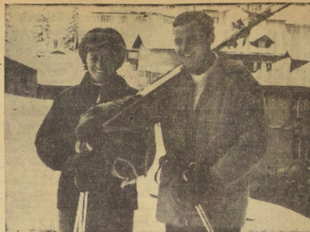
HERMANA DE KENNEDY: La hermana del Presidente Kennedy, Jean, casada con Stephen Smith, aparece, en el grabado, junto a su marido, en una aldea nevada de los Alpes Suizos...