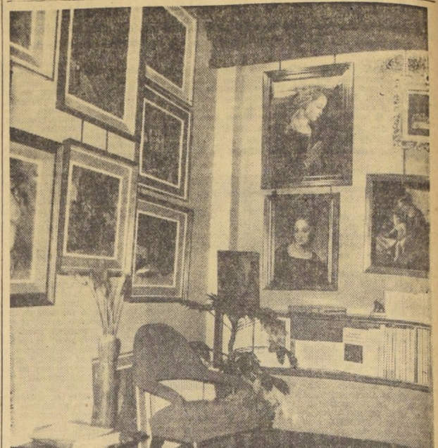
"IL CENACOLO"—La nueva sala de la librería italiana será no sólo local de exposiciones plásticas de alta calidad, sino lugar de cita para intelectuales, artistas y periodistas chilenos.