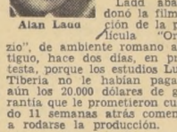
Alan Ladd abandonó la filmación de la película 'Orizzonte'...