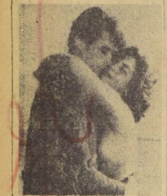
ARDOR DE ESTIO no es una película malsana de alcohol, ni tiene objeciones: es el amor puro favorecido por una naturaleza fuerte, apasionante, excesiva, casi salvaje. Exclusivamente para mayores de 21 años.

El tercer episodio de la obra de cinco episodios que se representa en el teatro "El Galpón" durante 20 días, y en Argentina estuvo seis meses trabajando en una sala teatral, en un teatro rodante y en el canal 7 de la televisión. La exhibición mímica de esta noche, a la cual han sido especialmente invitados los críticos de teatro, puede constituirse en la sorpresa artística de esta temporada.