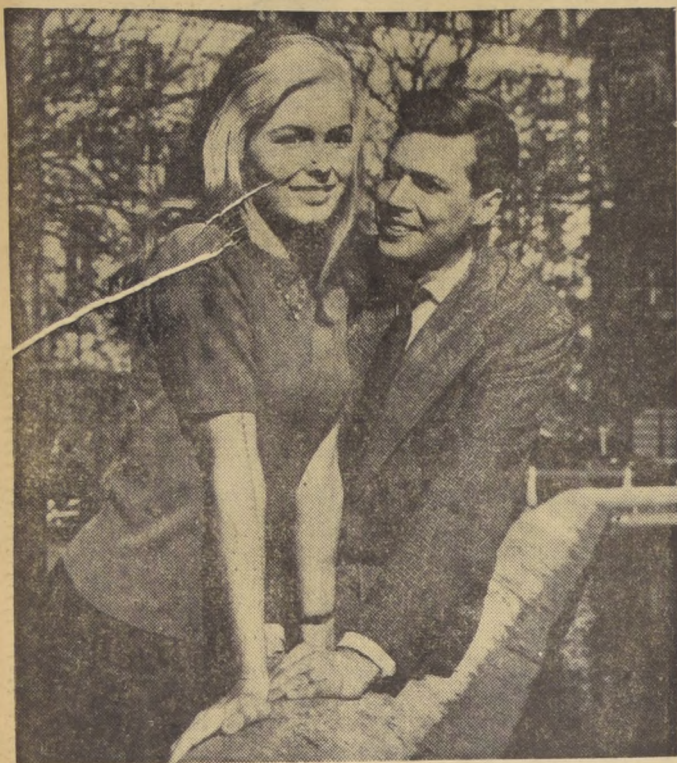
PARIS Y EL AMOR.— El actor Karl Boehm prescinde del panorama de París, y sólo tiene ojos para su bella esposa, Mouchie, mientras pasean por la capital de Francia. Boehm actor austriaco, está en París para la filmación de "Los Cuatro Jinetes del Apocalipsis".