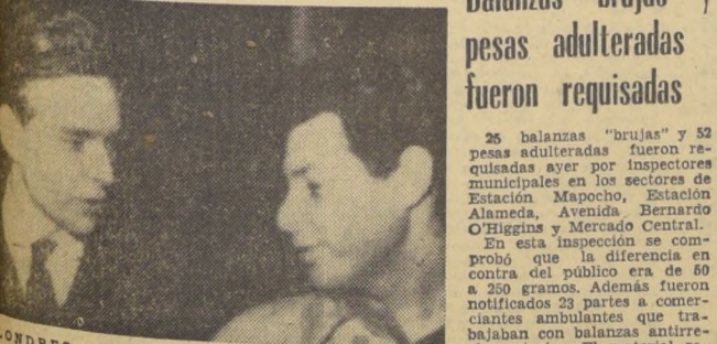
LONDRES.— Eddie Fisher sonríe mientras sale del hospital, el 8 de marzo, después de una visita que hiciera a su conyuge, Elizabeth Taylor, que está hospitalizada. (INFORMACION EN PAG. 5)