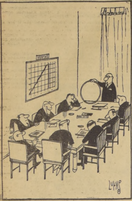
Nuestro problema consiste en encontrarle una nueva aplicación al Hula-Hoop.