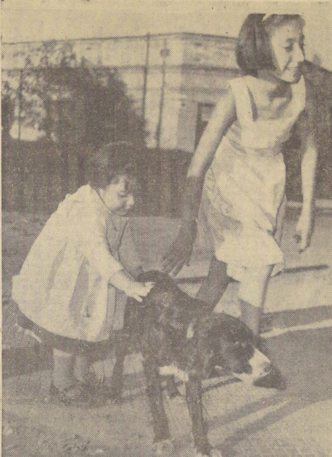
PASARON EL PELIGRO.— Un perro regalón atacó a sus pequeños amos, cuatro eran niños que jugaban a diario con él. Se llamaba "Cholo", y un accidente reveló que estaba contagiado con rabia y ponía en peligro sus vidas.