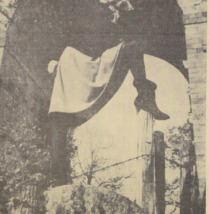
VERSALES (Francia).— Uno de los grandes arcos góticos de un suntuoso construido por Luis XIV, para suministrar agua a las fuentes de Versailles, sirve de fondo para esta fotografía de la actriz Yvette Mimieux. Yvette está en Francia para la nueva versión de la película "Los Cuatro Jinetes del Apocalipsis".