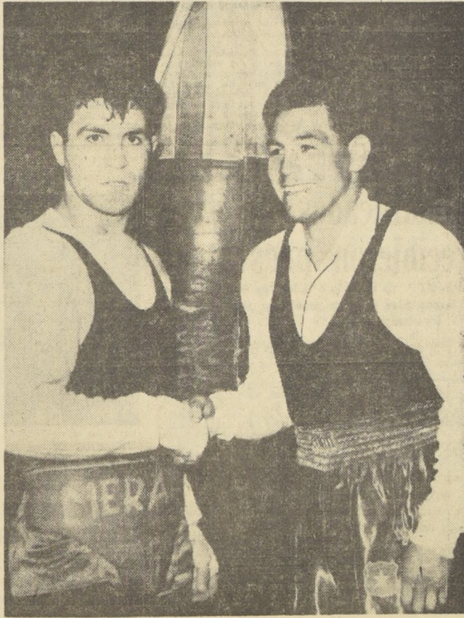
SERIO, PREOCUPADO, MERAYO; Sonriente, optimista, Lobos. La nota gráfica parece reflejar el estado anímico con que ambos rivales subirán esta noche al ring.