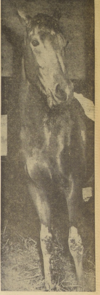
LA INGRATA, PUPILA de Juan Melero, que impresionó favorablemente en su salida de perdedoras y que después ha continuado trabajando con mucho brillo, debe ser de las favoritas en el Clásico "Cotejo de Potrancas", el primero de los grandes eventos del año.