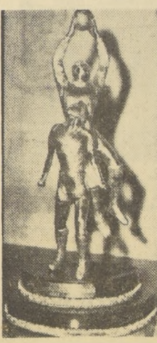
HERMOSO TROFEO: El ganador del 5.º Campeonato Nacional de Fútbol Juvenil, se adjudicará el Trofeo Dirección de Deportes del Estado, una artística figura de bronce.

Ocho equipos jugarán la rueda final en el Estadio Braden. — En la jornada que se inicia a las 15.30 horas, también actúan Cadetes con San Antonio.