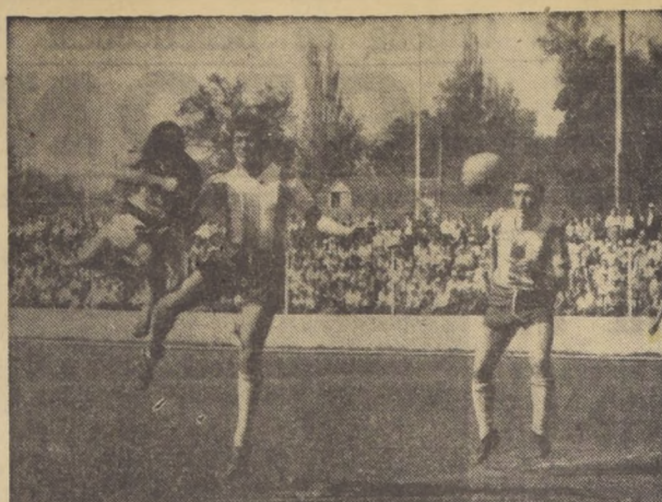
CON LOS PUÑOS CERRADOS se eleva el caleroano Silva, por sobre la presencia de Ampuero. Al final, Orviedo rechazará. Hubo tres expulsados en el empate a 1, entre Unión Calera y Magallanes.

● LISBOA, 12 (UPI). — Resultados de los partidos de hoy del campeonato de la Liga de Portugal: Académica-Leixoes 1-1, Guimarães-Lusitano 2-2, Benfica-C. U. F. 4-1, Barreirense-Sporting 3-1, Belenenses-Braga 2-1, y Civilta-Porto 1-3.