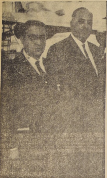
Ottorino Barassi y Ernest Thomen, vice y presidente de la Comisión Organizadora de la FIFA. El primero visitará los estadios de Rancagua y Concepción. Thomen irá a Rancagua, aparte de que ayer conocieron las obras del Estadio Nacional.

En grupos distintos inspeccionarán entre hoy y el jueves los estadios de Arica, Antofagasta, La Serena, Rancagua, Talca y Concepción. — Ayer conocieron las obras de ampliación del Estadio Nacional. — El sábado o domingo se harán las designaciones definitivas