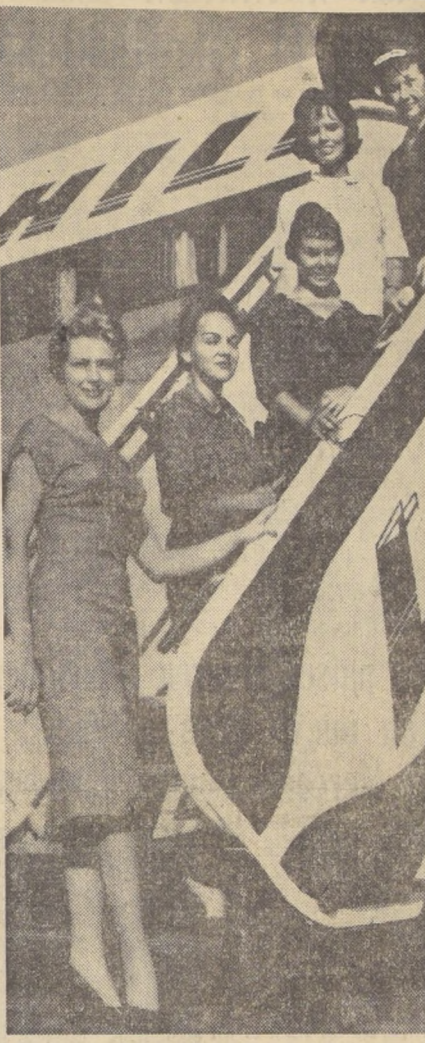
Estas cinco simpáticas auxiliares de vuelo de la National Airlines llegaron ayer a Santiago, vía LAN, a pasar sus vacaciones. En el grabado aparecen en el aeropuerto de Los Cerrillos.