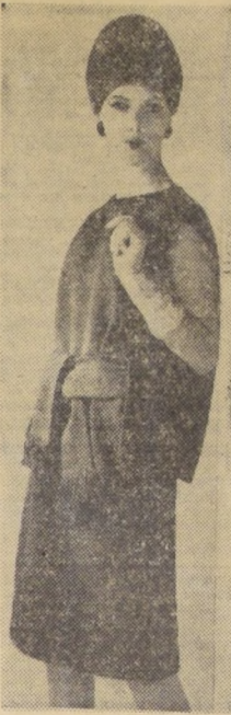
Clásico modelo Christian Dior de la moda Otoño-Invierno 1961. De escote sencillísimo, línea amplia y libre en torno de la silueta...