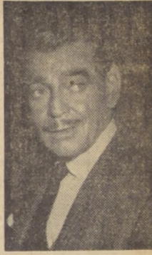
Ayer nació el único hijo del ex "Rey" del celuloso. Fue un robusto varón, que llevará el mismo nombre de su fallecido y famoso padre.