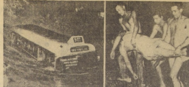
RIO DE JANEIRO. — Este bus (izquierda) que conducía 45 pasajeros, se precipitó al río Tinto, en los alrededores de esta ciudad, durante la tormenta tropical que azotó el país el 12 del presente. 19 personas por lo menos murieron ahogadas y otras tantas fueron arrastradas por la corriente. Sólo 16 personas lograron salvarse. El grabado de la derecha, muestra a una de las víctimas cuando es sacada del agua por los bomberos.

Según las propias fuentes del Presidente recomendará la creación de un nuevo organ-