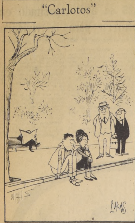
—En nuestros tiempos se llamaba pololeo, ahora le dicen "operación love".