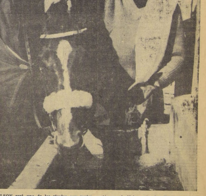
NELSON será uno de los rivales con mejor opción en el clásico palmeño. Ya ha probado que corre muy bien en la arena del Hipódromo Chile.

Respecto a la Argentina, las gestiones siguen avanzando, y en cualquier momento confirmarán la primicia que adelantamos hace dos días."